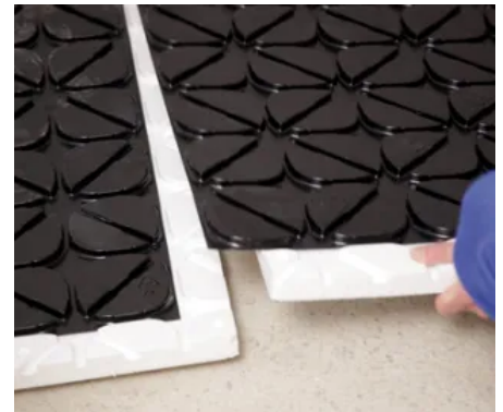
Durch den Folienüberstand lassen sich die Systemplatten sicher und estrichdicht verbinden.