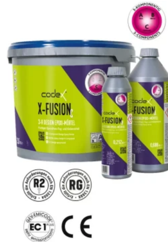
3-K-Epoxidharz Fug- und Klebemörtel codex X-Fusion