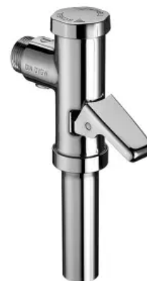
SCHELLOMAT mit Hebel

Wasserführende Teile Messing konform TrinkwV, Funktionsteile Kartusche Kunststoff