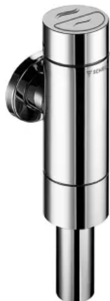
SCHELLOMAT SILENT ECO