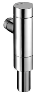
SCHELLOMAT BASIC ND

Wasserführende Teile Messing konform TrinkwV, Funktionsteile Kartusche Kunststoff