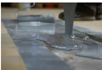
Füllung mit REVOPUR® Fugenliquid

Fugen werden täglich mit schweren Lasten befahren. Dabei müssen sie hohen Druckbelastungen durch schwere Fahrzeuge standhalten. Zu diesen mechanischen Beanspruchungen können Erschütterungen unterschiedlicher Herkunft und temperaturbedingte Längenänderungen hinzukommen. Im Fugenbau und in der Fugensanierung ist eine sorgfältige Ausführung daher besonders wichtig.