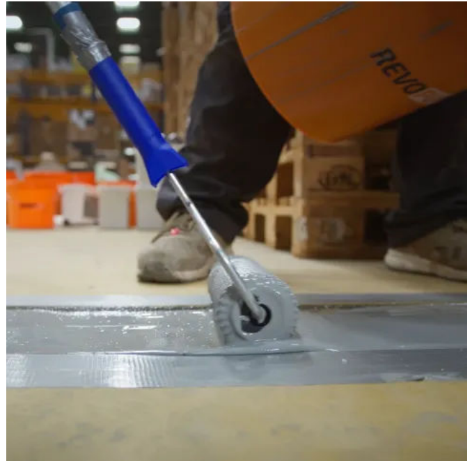
Fugensanierung mit REVOPUR® Fugenliquid

Detaillierte Hersteller-Informationen zu Fugensbau und Fugensanierung