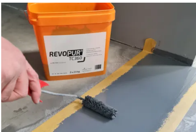
Farbliche Gestaltung mit REVOPUR® TC360