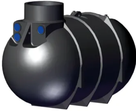
Klassischer, zylindrischer Erdtank: BlueLine II

Aus der Serie Regenwasser-Nutzungsanlagen Rewatec von PREMIER TECH Rewatec