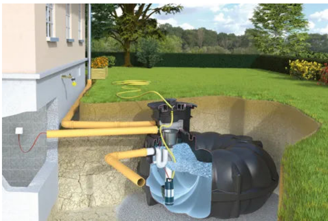
Garten-Kompletanlage Profi – Mit besonders leistungsstarker Tauchdruckpumpe, Profi-Filterschacht und Wasserentnahme im Tankdeckel