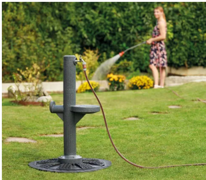
Vielseitige und komfortable Wasserentnahme mit Zapfsäule. Exklusiv bei Rewatec ist die Zapfsäule auf den Tankdeckel aufsetzbar

Regenwasser ist viel weicher und kalkfreier als Trinkwasser, das mögen Pflanzen besonders gern. Da liegt es nahe, kostenloses Regenwasser zu sammeln und für die Bewässerung an trockenen Tagen zu nutzen.