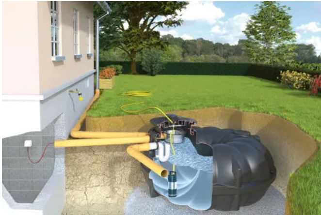
Garten-Kompletanlage Evo – Mit besonders leistungsstarker Tauchdruckpumpe und Wasserentnahme im Tankdeckel

Aus der Serie Regenwasser-Nutzungsanlagen Rewatec von PREMIER TECH Rewatec