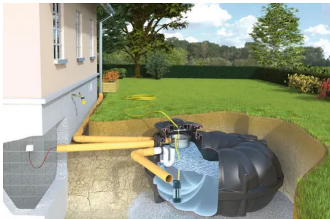
Garten-Komplettanlage Basic – die preiswerte Lösung mit Wasserentnahme im Tankdeckel