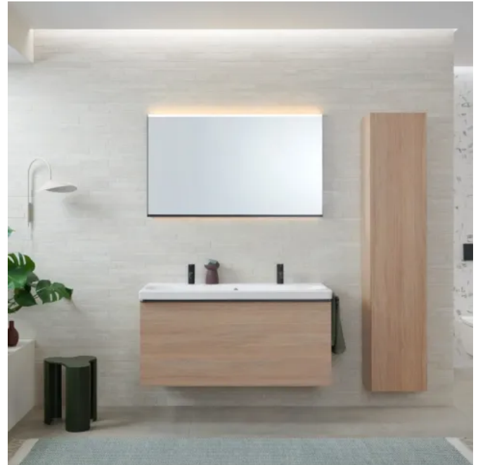
Neben zwei Glasoberflächen in Weiß und Lava sind Möbeloberflächen in Weiß glanz, Weiß matt, Lava matt sowie Melamin Eiche und Nussbaum im Acanto Sortiment.