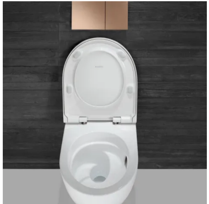
Die Lenkung des Wassers beim Spülvorgang wird durch Neuerungen präzise beeinflusst, dass eine gründlichere und leisere Ausspülung erreicht wird.

Um jeden Bereich der Keramik bei der Ausspülung zu erreichen, wurde eine umlaufende Führungskante entwickelt. Sie das Wasser vollflächig bis unter die WC-Oberkante. Indem das Wasser kontrolliert durch die gesamte Keramik strömt, ist eine vollständige und kraftvolle Flächenspülung garantiert. Für den Boden der Keramik wurde eine wasserleitende Kante entwickelt, die den Wasserstrudel so lenkt, dass ein Teil davon direkt in den Siphon geleitet wird. Dies verhindert, dass im Inneren des Wasserstrudels ein Hohlraum entsteht und leichte Rückstände wie beispielsweise Toilettenpapier nicht restlos weggespült werden. Die Kante nutzt den Schwung des Wassers und sorgt dafür, dass auch das Zentrum des Wasserstrudels ausgespült wird.