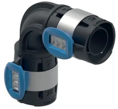
Geberit FlowFit Bogen