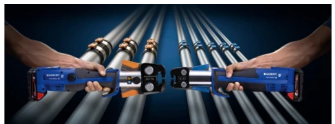
Mit nur zwei Pressbacken lassen sich die acht Rohrdimensionen von d16 bis d75 verarbeiten.

Das FlowFit Fittingsortiment besteht aus PPSU- und bleifreien Rotgussfittings.