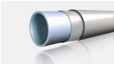
Geberit Systemrohr ML

Aus der Serie Versorgungs- und Entwässerungssysteme von Geberit