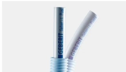
Geberit Systemrohr PB mit Schutzrohr