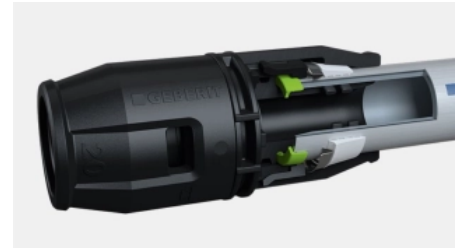
Geberit PushFit Steckfitting