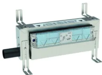
Geberit Kombifix Element für Dusche mit Wandablauf

Die Geberit Duofix Elemente für Duschen gibt es als Variante für Unterputz- sowie für Aufputz-Armaturen. Beide sind für teilhohe und raumhohe Installationswände geeignet. Zusätzlich steht ein niedriges Trockenbauelement zum Einbau in Installationswände zur Verfügung. Für Dusch- und Badewannen bietet Geberit zusätzlich Installationselemente und Traversen für Aufputz- und Unterputzarmaturen ohne Wandablauf.