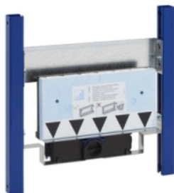
Geberit Duofix Trockenbauelement zum Einbau in Installationswände