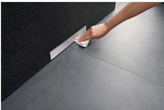
Der Wandablauf lässt sich einfach sauber halten.