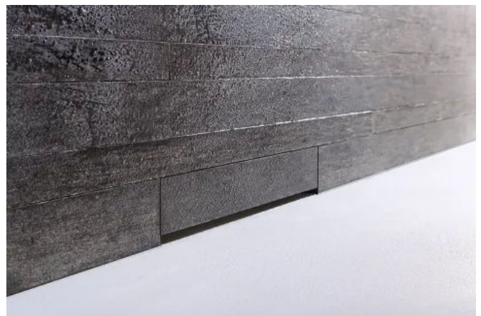
Die Abdeckung des Wandablaufs kann auch passend zur Badgestaltung mit Platten belegt werden.