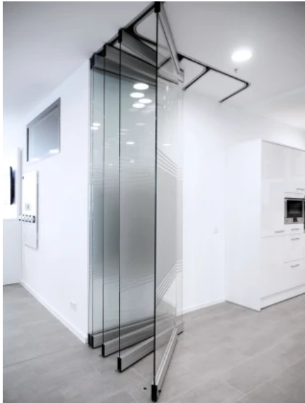
MSW Comfort – Bewegliches Ganzglas-Trennwandsystem, © GEZE GmbH / Jürgen Biniasch