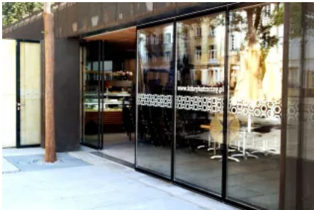
MSW verfahrbare Durchgangstür - IGG