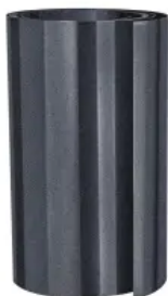
Bandblech 500 kg, Oberfläche TX, Anthrazit