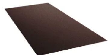
Tafelblech, Oberfläche SX, Testa di Moro

Produktauswahl und weitere Informationen: GRÖMO DUOFALZ Band- und Tafelbleche