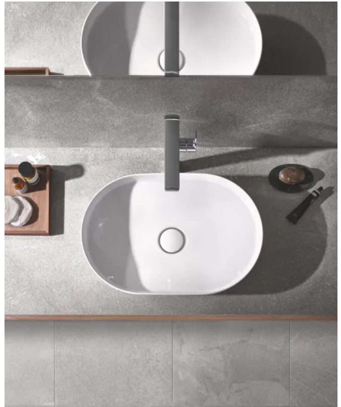
GROHE Airio. Durch die harmonischen Linien passt dieser ovale Waschtisch besonders gut zu den Armaturenkollektionen Allure und Atrio.