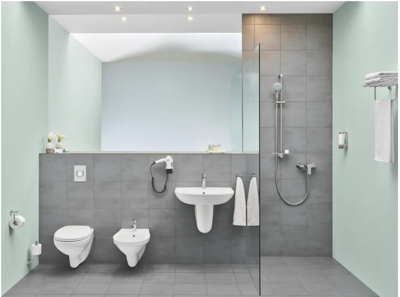
Grohe Bau Keramik

Bau Keramik ist ein Alleskönner mit modernster Technologie. Mit der spülrandlosen Technik ohne Aufpreis bieten die WCs erheblichen Mehrwert durch höchste Hygienestandards.