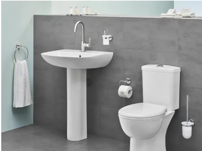
Grohe Bau Keramik Stand-WC mit Wand-Waschtisch

Aus der Serie GROHE Badkeramik von GROHE