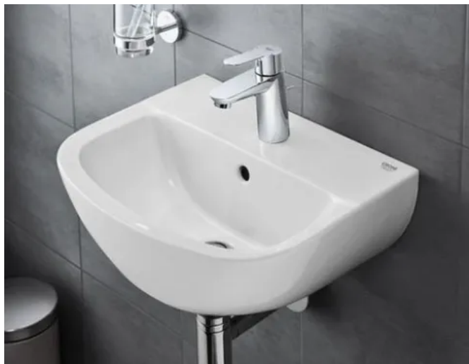
Kompakter GROHE Bau Keramik Waschtisch für kleine Räume

Aus der Serie GROHE Badkeramik von GROHE