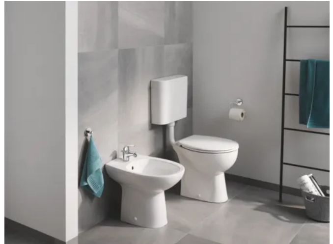
Grohe Bau Keramik Stand-WC und -Bidet

Dank ihrer schlanken Form ist Bau Keramik ideal für den Einsatz im Wohn- und Objektbau.