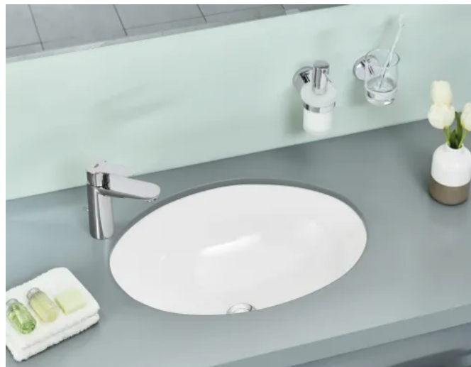
GROHE Bau Keramik Unterbauwaschtisch