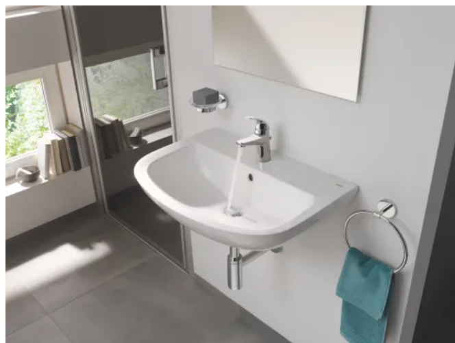
GROHE PerfectMatch Kombination