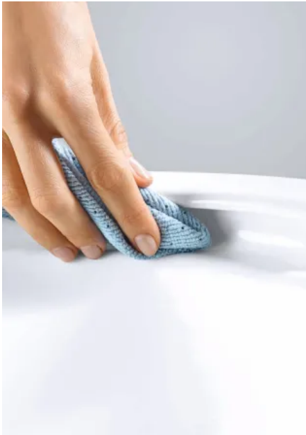
RANDLOS-Technologie für WCs

Weitere Informationen zu GROHE Technologien