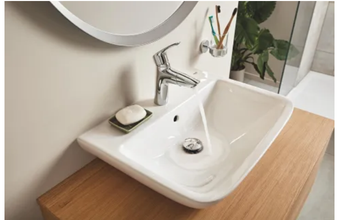
GROHE BauEdge Keramik Waschtisch

Die Waschtische mit weichen Linien aus langlebiger Keramik verleihen dem Bad eine moderne Optik. In drei Größen verfügbar, 600 x 450 mm, 550 x 400 mm und als Handwaschbecken in kompakten Maßen 450 x 350 mm.