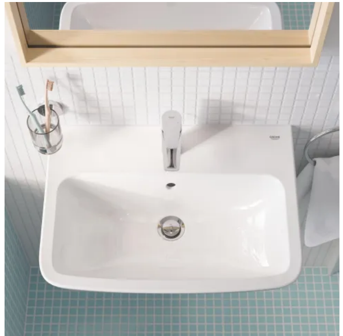
GROHE PerfectMatch Kombination