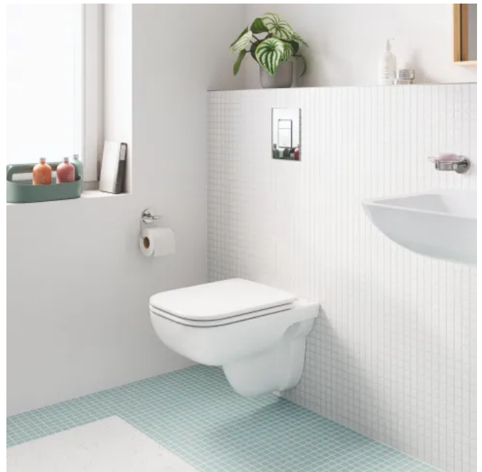
Grohe BauEdge Keramik WC

BauEdge WCs sind mit der spülrandlosen Technik ausgestattet und erfüllen hohe Hygienestandards. Die bodenstehenden oder wandmontierten Varianten fügen sich durch ihr minimalistisches Design in jedes Bad problemlos ein. Dank der GROHE Randlos-Technologie lassen sich die WCs mühelos reinigen. Sie sind mit WC-Sitzen mit Soft Close und Quick-Release-Funktion kombinierbar.