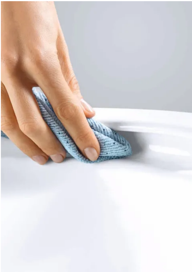
RANDLOS-Technologie für WCs

Dank der GROHE Randlos-Technologie lässt sich die komplette Oberfläche des WCs leicht erreichen und reinigen, sogar jene Stellen, die man nicht sieht. So können Bakterien sich nicht mehr in Winkeln und Ecken unter dem Rand verstecken. Die GROHE Randlos-Technologie garantiert schnelles und einfaches Reinigen der WCs.