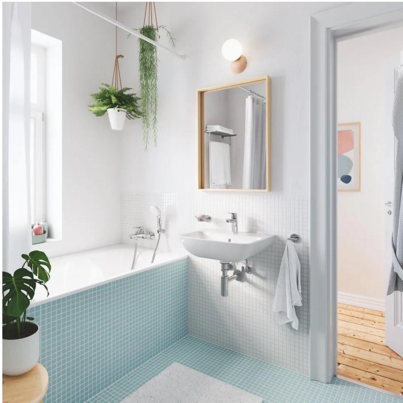
Grohe BauEdge Keramik