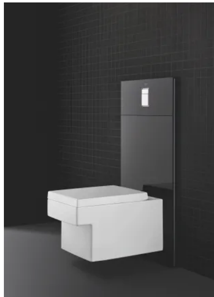
Cube Keramik Wand-Tiefspül-WC