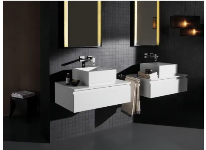
Einzelwaschtisch Cube Keramik