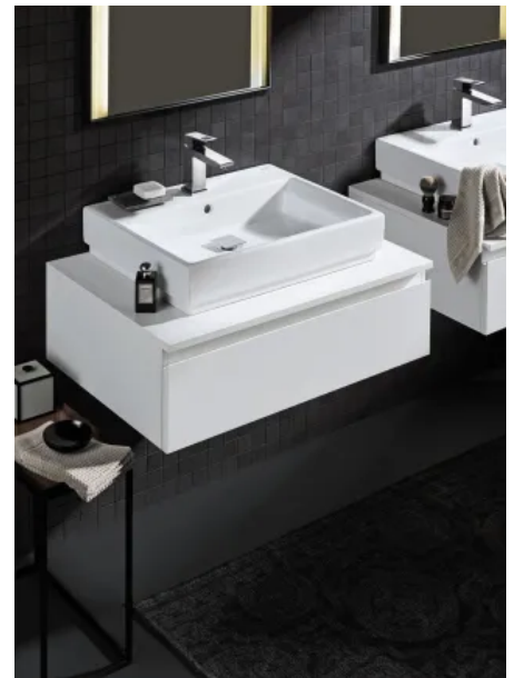
Cube Keramik Aufsatzwaschtisch