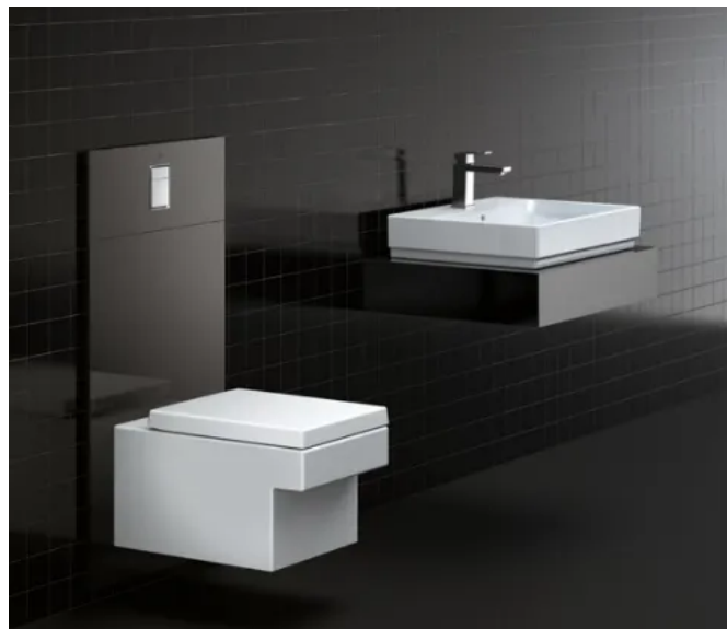
GROHE PerfectMatch Kombination