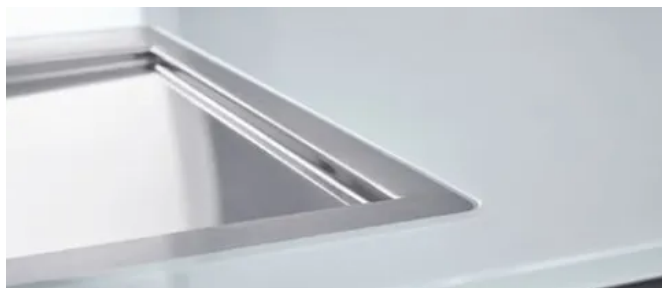
Einbau flächenbündig, in einer 1,5 mm tiefen Aussparung. Alternativ auf der Arbeitsfläche.