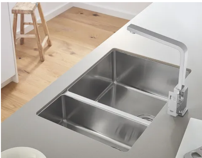
Modell K700 Unterbau

Die K700 Unterbau-Spüle steht für einen klaren, architektonischen Look. Das Design mit dem tieferen Becken und den sanften Rändern sorgt für ein nahtloses, modernes Finish. Erhältlich mit 1 oder 1,5 Becken mit dem größeren Becken links oder rechts.