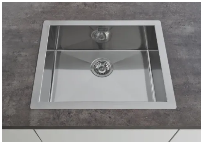
GROHE Spüle K700 aus Edelstahl, flächenbündig eingebaut