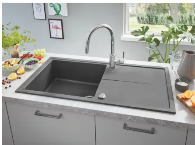
GROHE K400 Spüle aus Quartzkomposit

GROHE Spülen passen in verschiedene Küchenkonzepte und lassen sich mit den GROHE Küchenarmaturen und Wassersystemen kombinieren – sowohl im Design als auch in der Funktionalität, mit komfortablen Proportionen. Durch das QuickFix-System und die serienmäßige Wendeausführung lassen sich die GROHE Küchenspülen in wenigen Minuten problemlos installieren. Kompaktmodelle mit integriertem Ablauf, großen Doppelspülen oder edle Einbauspülen bieten vielfältige