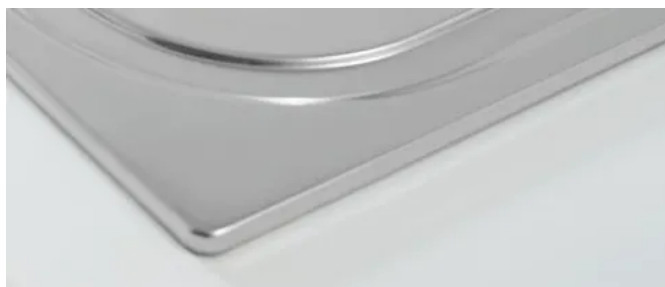
Standard-Einbau, mit Einbaukante 8 mm