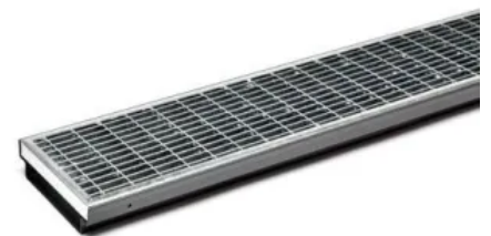
AquaDrain® KR/ KR-U

Flexibel ablängbares und stufenlos höhenverstellbares Drainrost-System für regelgerechte Türanschlüsse ohne Sonderanfertigung.