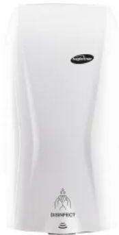
XIBU DISINFECT hybrid berührungsloser Händedesinfektionsspender – WHITE