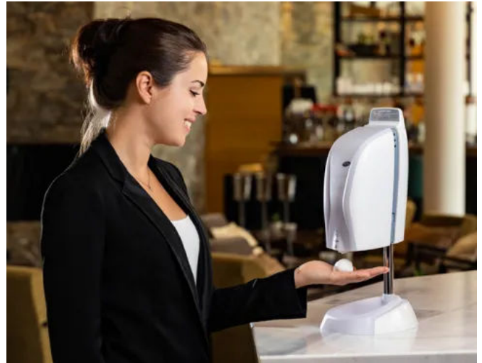
Tischstandfuß mit integrierter Tropfzasse für den XIBU DISINFECT hybrid