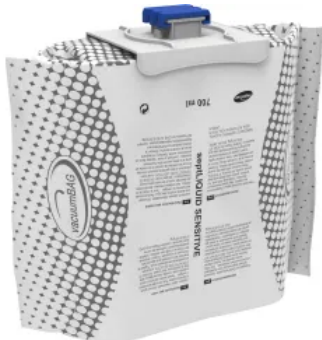
septLIQUID SENSITIVE Händedesinfektion

Aus der Serie Hygienespender für Desinfektion, Wasch- und Sanitärbereiche von Hagleitner Hygiene International