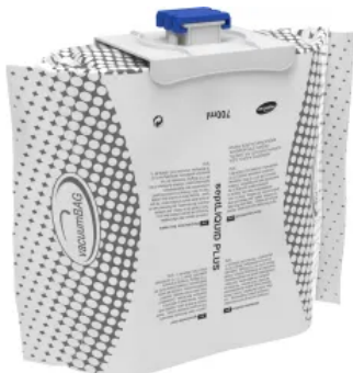
septLIQUID PLUS Viruzide Händedesinfektion