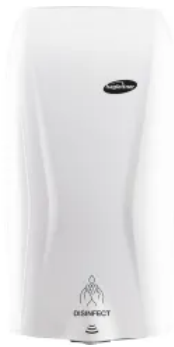
XIBU DISINFECT GEL hybrid Berührungsloser Gel-Desinfektionsmittelspender – WHITE