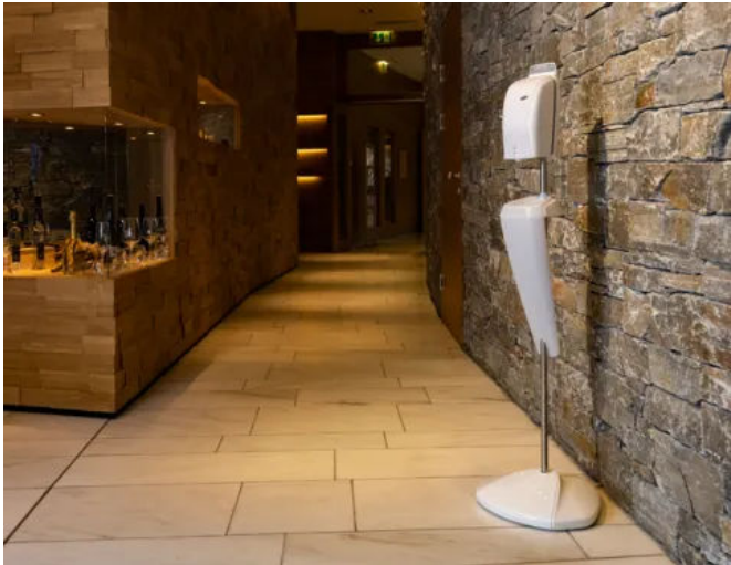
Bodenstandfuß mit integrierter Tropfzasse für den Spender XIBU DISINFECT hybrid

Aus der Serie Hygienespender für Desinfektion, Wasch- und Sanitärbereiche von Hagleitner Hygiene International