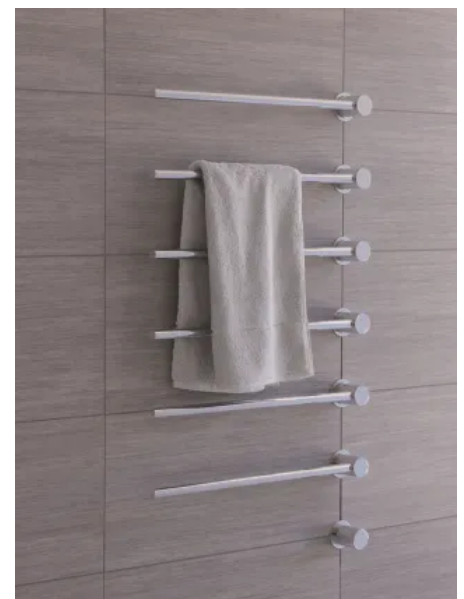
T39EL / 6