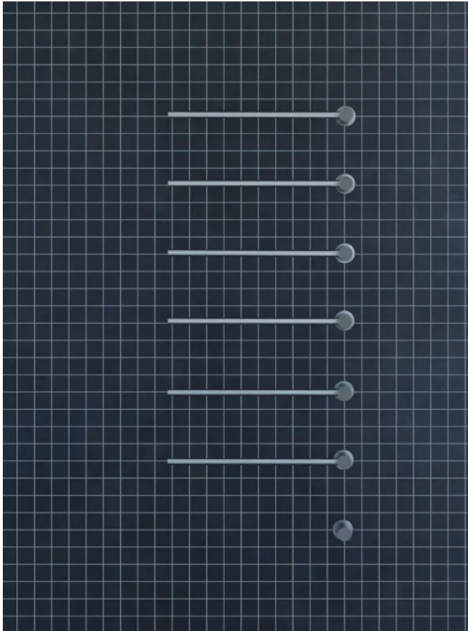
T39EL / 6

Aus der Serie Sanitärarmaturen und Accessoires von VOLA