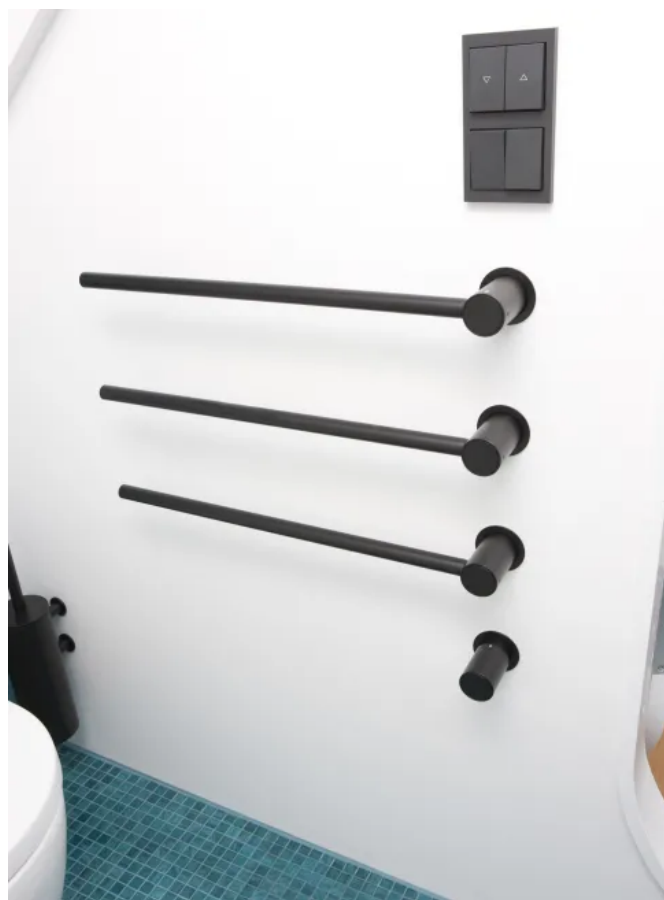
T39EL / 3