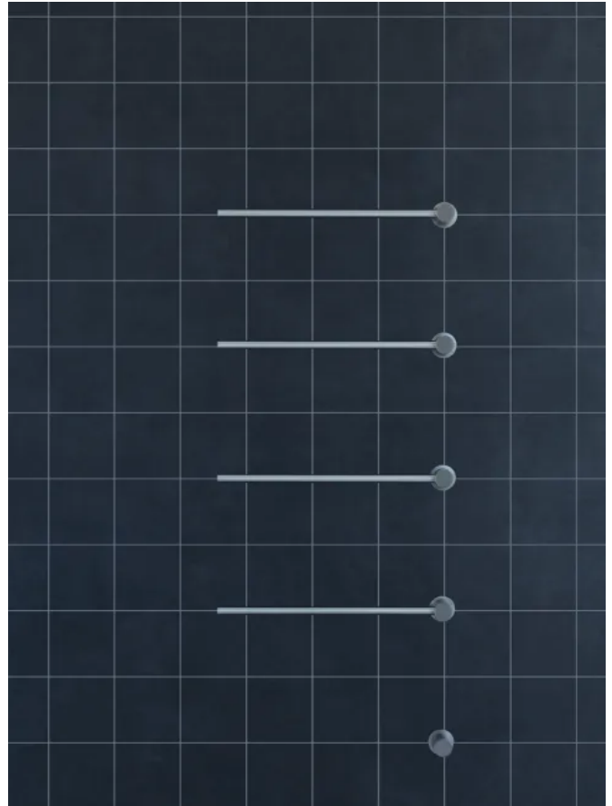
T39EL / 4