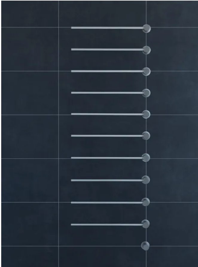
T39EL / 10

Aus der Serie Sanitärarmaturen und Accessoires von VOLA