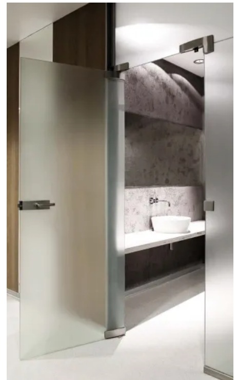
Ganzglasanlage in Satinato-Optik

Der Individualität sind bei HEILER Ganzglasanlagen keine Grenzen gesetzt. Nahezu jede denkbare Konstruktion ist möglich. Die verschiedenen Varianten bestehen immer aus mindestens einem Festglaselement, welches durch eine beliebige Anzahl freier Elemente ergänzt werden kann. Als Durchgang lassen sich Schiebe-, Dreh- oder Pendeltür einsetzen. Diverse Glasveredelungsarten wie Folieren, keramischer Siebdruck oder Digitaldruck stehen zur Auswahl.