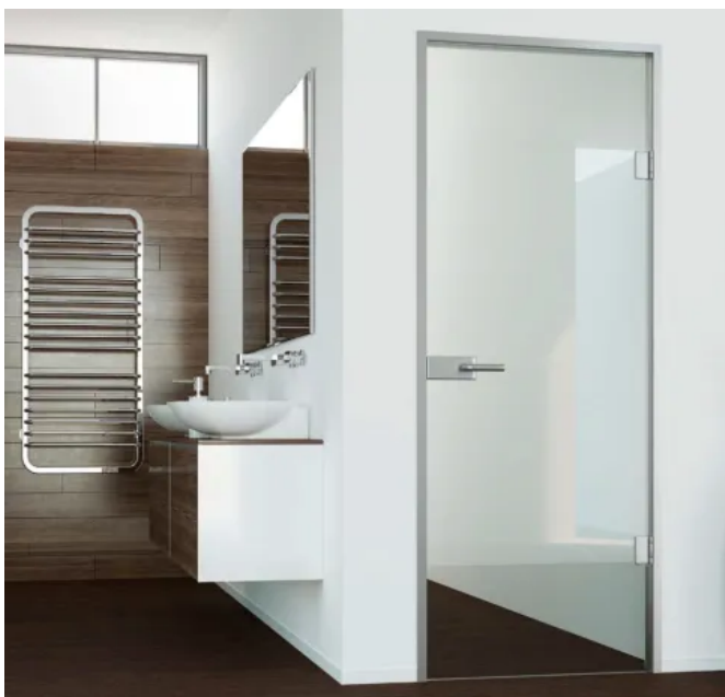
Glasinnentür mit Drückergarnitur eckig, Silber matt

Die Innentüren werden aus biege- und bruchfestem Einscheiben- oder Verbund-Sicherheitsglas gefertigt.