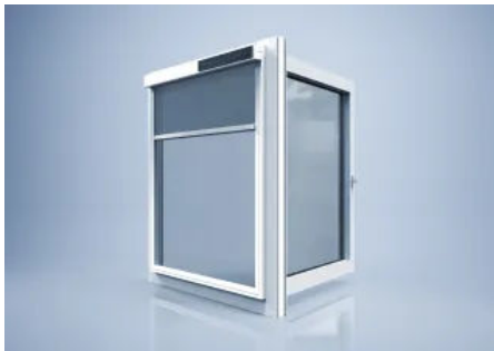
Klemmbarer Sonnenschutz heroal VS Z EM

Weitere Informationen zum Sonnenschutzsystem heroal VS Z