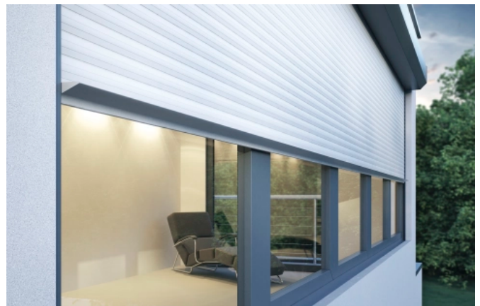
Detail Rollladenendleiste aus massivem Aluminium