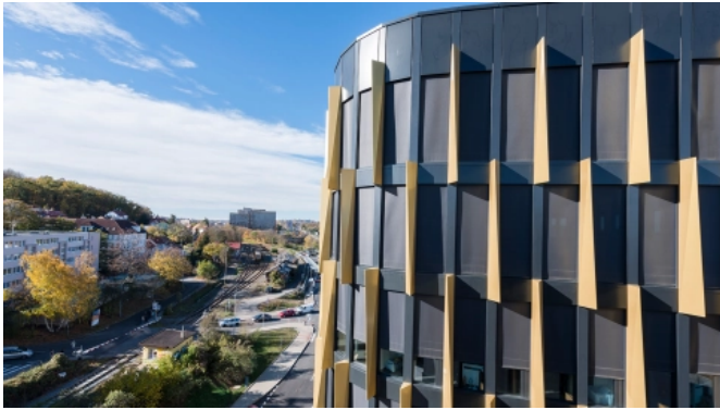
Gebäudekomplex AFI Vokovice in Prag