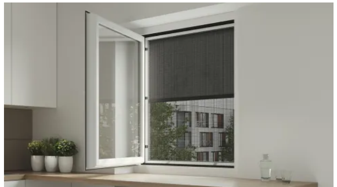
Klemmbarer Sonnenschutz heroal VS Z EM