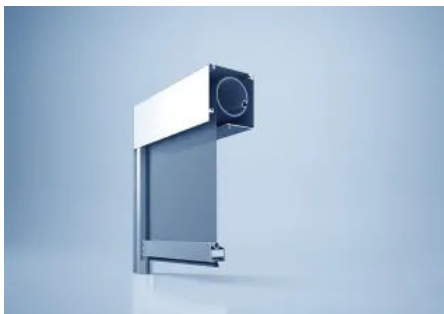
Zipscreen-System heroal VS Z