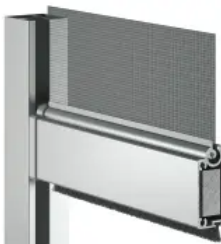
Sonnenschutzsystem heroyal VS

Weitere Informationen zum Sonnenschutzsystem heroyal VS C