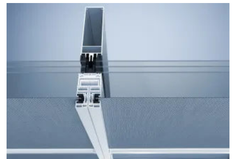
Sonnenschutzsystem heroal VS Z CZ teilintegriert

Um das Sonnenschutzsystem heroal VS Z nahtlos in Pfosten-Riegel-Fassaden wie heroal C 50 zu integrieren, wurde heroal VS Z CS (Curtain Wall Screen) mit der Führungsschiene heroal GR 25 entwickelt. Das System kann auf gängige Pfosten-Riegel-Systeme mit mind. 50 mm Ansichtsbreite als klassische Vorbaumontage mittels Standard-Sonnenschutzbolzen montiert werden. Den Anschraubgrund für heroal VS Z CS bietet ein Integrationsprofil, welches schon in der Werkstatt mit den Fassaden-Pfosten bearbeitet werden kann.