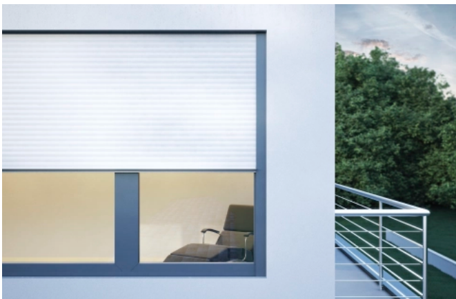
Detail Rollladenblenden bei Unterputzeinbau