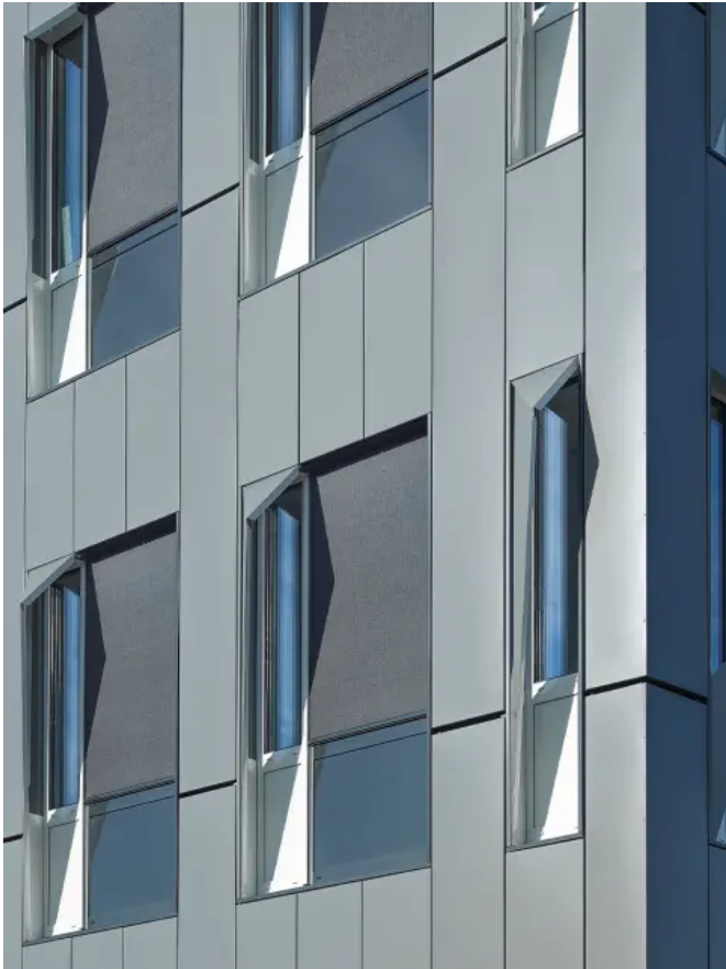
Firmengebäude Ovesco Endoscopy AG in Tübingen

Aus der Serie heroal Sonnenschutzsysteme von heroal