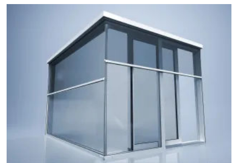
Zipscreen-System heroal VS Z Ecklösung (© heroal)

Die heroal VS Z Ecklösung besteht aus zwei Textilscreens mit Zip-Führung an den Seiten und einer Seilführung im Eckbereich, die für effizienten Sonnenschutz an Ecken (z. B. Ganzglasecken) sorgen. Besonders raffiniert: Der Behang wird mit separaten Endleisten geführt, die beide in nur einer Seilführung verlaufen. So lassen sich die Screens unabhängig voneinander steuern und können variabel an den Stand der Sonne angepasst werden.