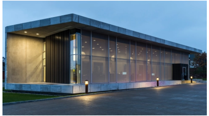
Gebäude in Viborg