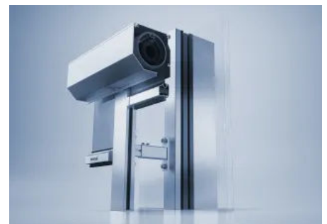
Vollintegriertes Sonnenschutzsystem heroal VS Z CS vorgesetzt

Um das Sonnenschutzsystem heroal VS Z nahtlos in Pfosten-Riegel-Fassaden wie heroal C 50 zu integrieren, wurde heroal VS Z CS (Curtain Wall Screen) mit der Führungsschiene heroal GR 37 entwickelt. Das System kann auf gängige Pfosten-Riegel-Systeme mit mind. 50 mm Ansichtsbreite als klassische Vorbaumontage mittels Standard-Sonnenschutzbolzen montiert werden. Den Anschraubgrund für heroal VS Z CS bieten Traversen in unterschiedlichen Längen. Durch den individuellen Abstand zur Fassade kann es z. B. auch vor Absturzsicherungen eingebaut werden.