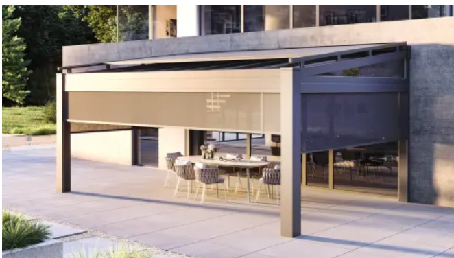
Terrassenüberdeckung heroal OR mit Markise