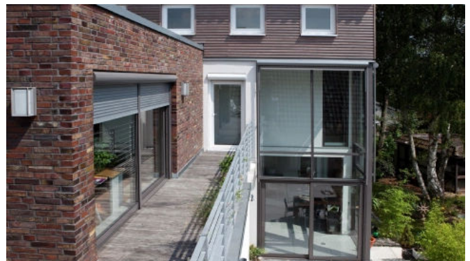
Wohnhaus mit Dachterrasse