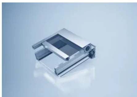
Horizontalmarkise heroyal HS (© heroyal)