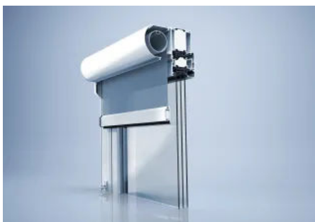
Sonnenschutzsystem heroal VS C

Weitere Informationen zum Sonnenschutzsystem heroal VS Z EM