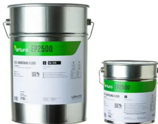
Arturo EP2500: Lösemittelfreie, farbige 2-Komponenten Bodenbeschichtung auf Epoxidharzbasis