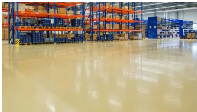
Verlaufbeschichtung ARTURO EP2500 in den Produktions- und Lagerhallen der Kissling Elektrotechnik GmbH