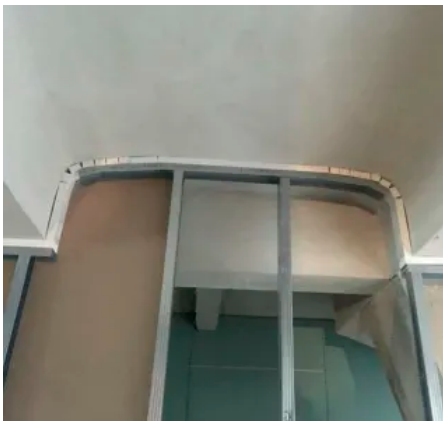
Passgenau der Kontur folgend

maxit ip 160 ist als Putz der Gruppe CS II nach DIN EN 998-1 für die Außenanwendung geeignet und kann durch die o. g. Verarbeitungsverfahren auch auf die Anforderungen im Tunnelbauwerk zugeschnitten werden. Zudem ist maxit ip 160 prädestiniert für die Verwendung in Bereichen mit hoher Luftfeuchtigkeit wie Parkhäuser, Fassaden Tiefgaragen, Kellerräume.