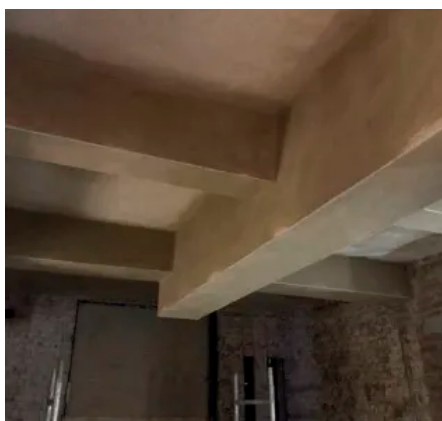
Kastenförmige Bekleidung von Deckenträgern