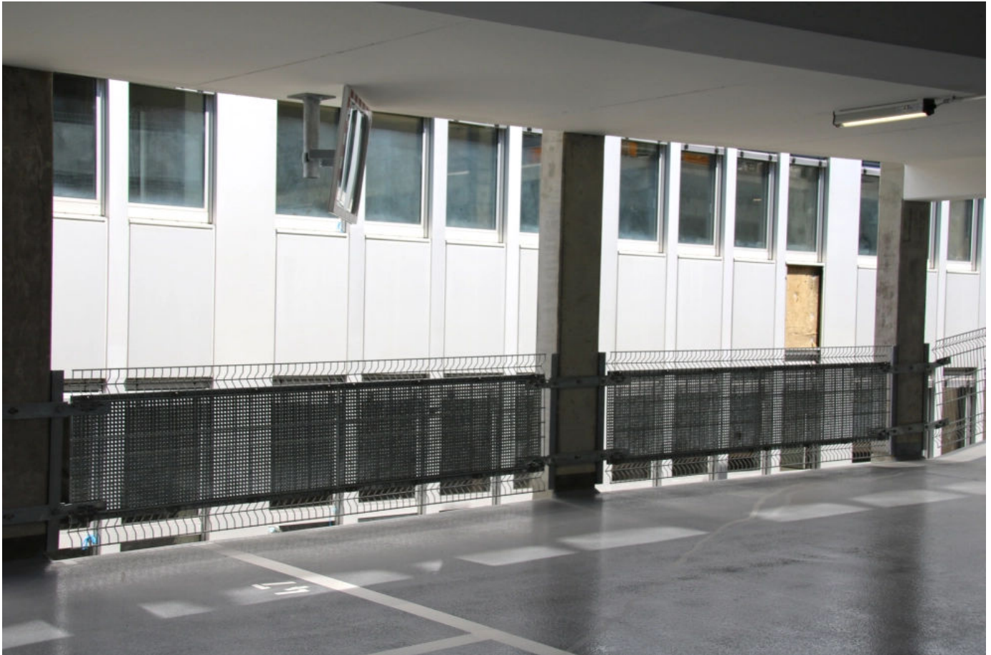
INTEGRA-pw Extra Blendschutz

Aus der Serie INTEGRA-pw Parkhaus-Absturzsicherung und Anprallschutz von projekt w Systeme aus Stahl