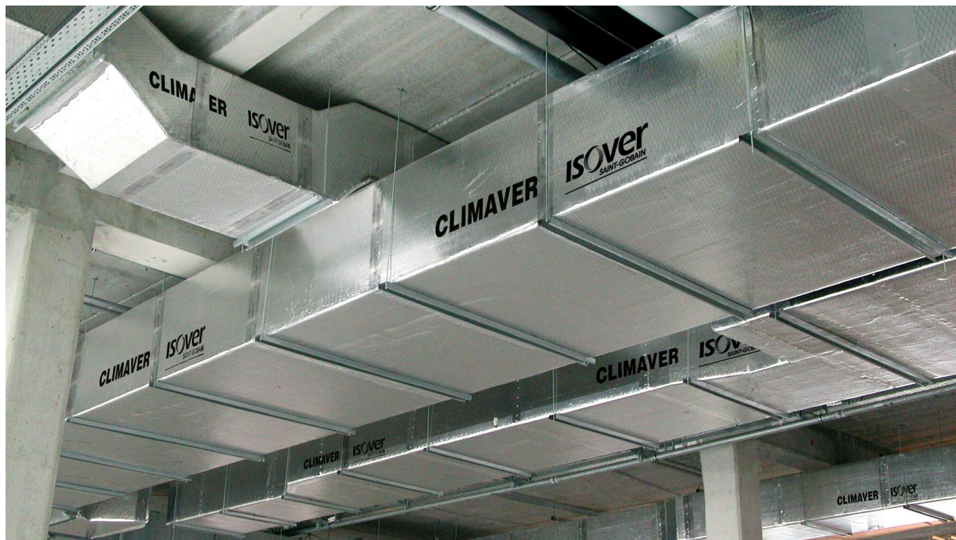
ISOVER CLIMAVER® – Lüftungskanal und Dämmung in einem Bauteil

Aus der Serie ISOVER Haustechnik - Lüftungskanäle und Dämmschalen für Rohrleitungen von SAINT-GOBAIN ISOVER