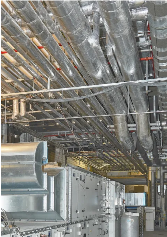
U Protect Rohrschalen aus ULTIMATE-Dämmstoff als 2-in-1-Lösung ermöglichen Brand- und Wärmeschutz von brennbaren und nichtbrennbaren Rohrleitungen und Rohrdurchführungen.