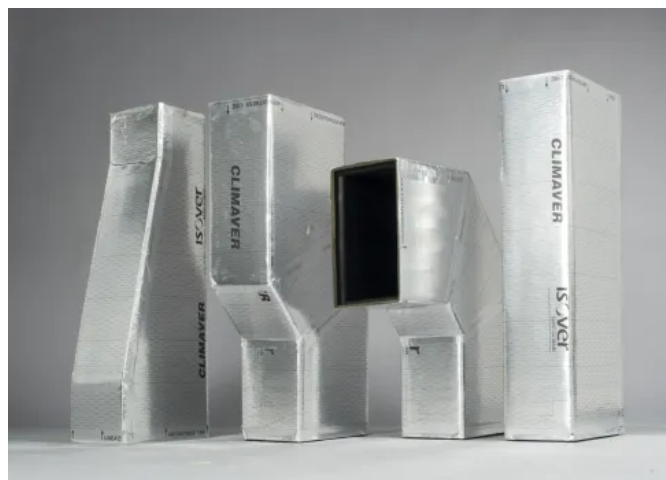
Der Bau aller Kanalsegmente von CLIMAVER® A2 neto kann direkt vor Ort erfolgen

CLIMAVER® ist ein Komplettsystem für die Herstellung selbsttragender Lüftungskanäle. Als All-in-One Lösung aus beidseitig kaschierten Glaswolle-Dämmplatten ist CLIMAVER® A2 neto Lüftungskanal und Dämmung in einem Bauteil. Auf einen zusätzlichen vorgefertigten Stahlblechkanal kann somit verzichtet werden. CLIMAVER® A2 neto bietet sehr gute Schallschutzeigenschaften bei geringem Gewicht. Die patentierte Beschichtung der Kanal-Innenseite bietet Mikroorganismen keinen Nährboden und gewährleistet eine hohe Raumluftqualität.