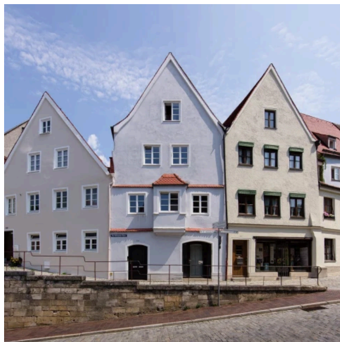
Von Helfensteingasse Landsberg am Lech

Technisches Merkblatt KEIM GRANITAL®-GROB