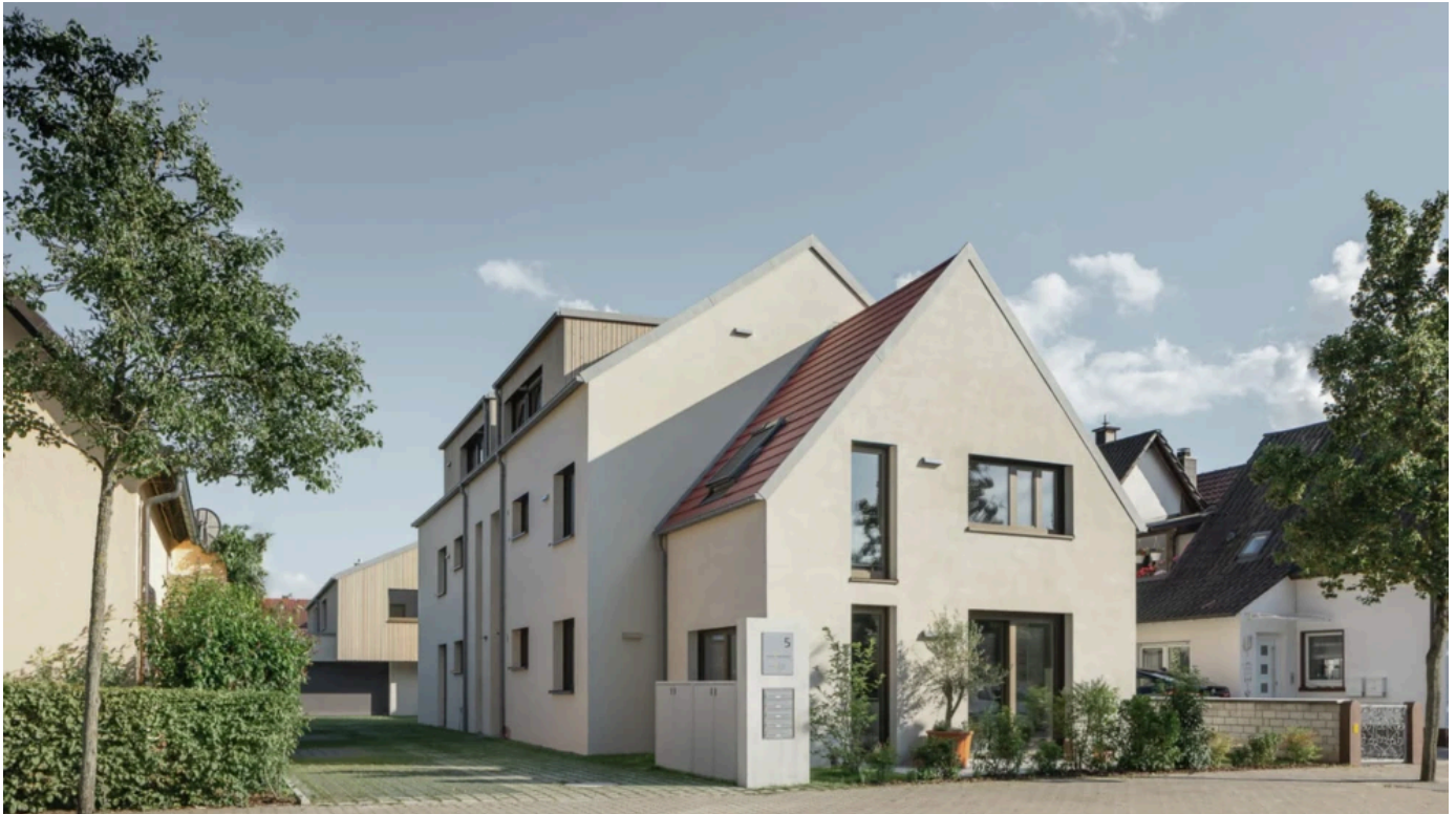
Munsky Einfamilien-Häuser in Kandel

Aus der Serie Silikat-Fassadenfarben und Anstrichsysteme von KEIMFARBEN