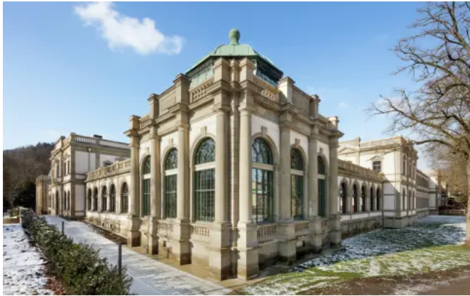
Luitpoldbad in Bad Kissingen

Aus der Serie Silikat-Fassadenfarben und Anstrichsysteme von KEIMFARBEN