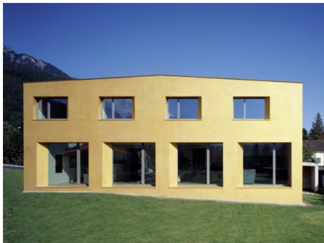
Wohnhaus in Azmoos, Schweiz

Eine geringe Wasseraufnahme und eine hohe Wasserdampfdurchlässigkeit führen zu geringer Verschmutzung, einem natürlichen Schutz gegen Algen- und Pilzbefall und somit zu einer deutlich höheren Lebensdauer mit längeren Renovierungszyklen als bei nichtmineralischen Anstrichen.