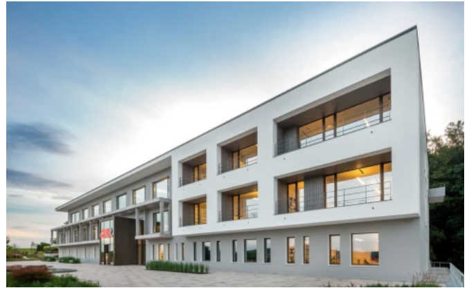
Firmenzentrale Josef Rädlinger in Cham