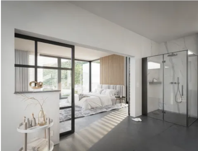
KERMOS Wandverkleidung mit Aluverbundplatte Natural Stone White

Aus der Serie Innenraumlösungen von KERMOS eine Marke der STARK Deutschland