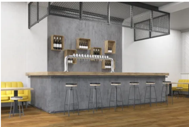
KERMOS Wandverkleidung mit Aluverbundplatte Stone Grey