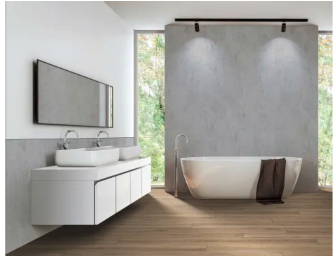
KERMOS Wandverkleidung mit Aluverbundplatte Natural Stone Light Grey