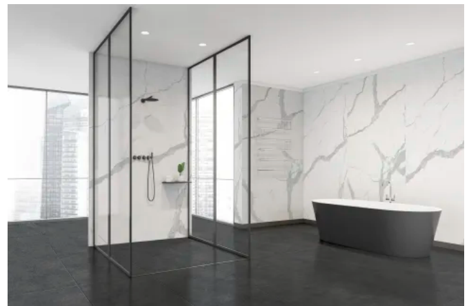
KERMOS Wandverkleidung mit Aluverbundplatte Natural Stone White

Mehr zu den KERMOS Raumkonzepten im KERMOS Katalog