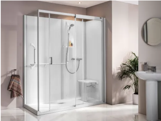
Kinemagic Royal +

Aus der Serie Kinedo: Innovative Dusch- und Badlösungen von SFA Deutschland