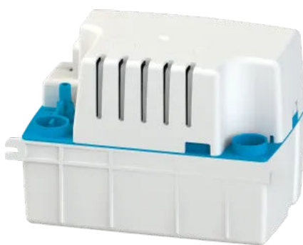
Sanicondes Pro N