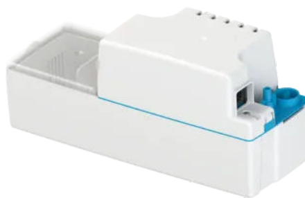
Sanicondes Best Flat