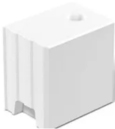
KS-Fasensteine (KS F) nach DIN V 106

Aus der Serie KS Mauersteine aus Kalksandstein von KS-ORIGINAL