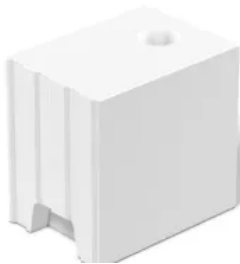
KS-R-Blocksteine (KS-R) nach DIN V 106

Aus der Serie KS Mauersteine aus Kalksandstein von KS-ORIGINAL