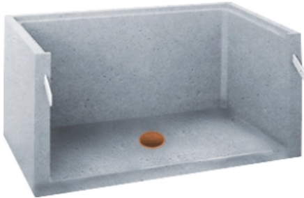
Einhängelichtschächte Typ D (Abbildung mit Boden)

Standard-Lichtmaße (cm): 80 x 50, 80 x 60, 100 x 50, 100 x 60, 130 x 50, 130 x 60, 155 x 50, 155 x 60, 180 x 50, 180 x 60, 205 x 50, 205 x 60