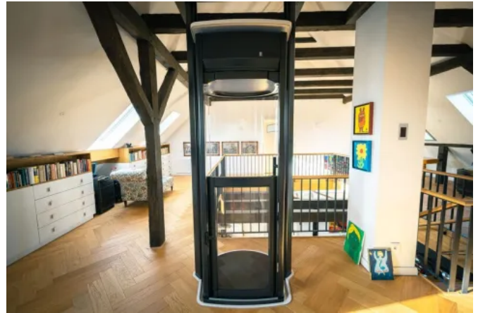
Homelift Lifton TRIO, Oberfläche schwarz foliert