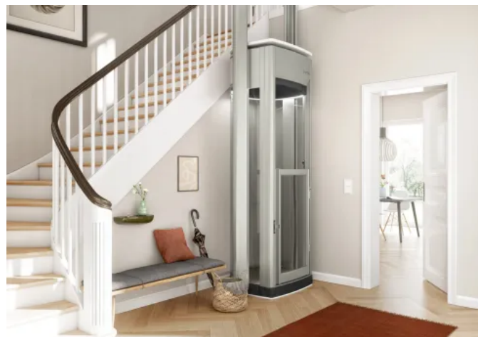
Homelift Lifton DUO verbindet zwei Geschosse barrierefrei und bietet Platz für eine Person.