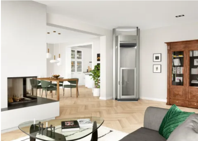
Homelift Lifton DUO