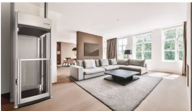
Homelift Lifton TRIO, Oberfläche hellgrau foliert