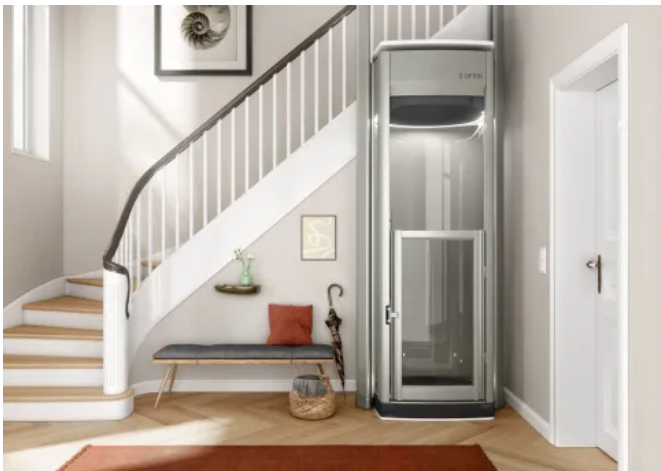
Homelift Lifton DUO