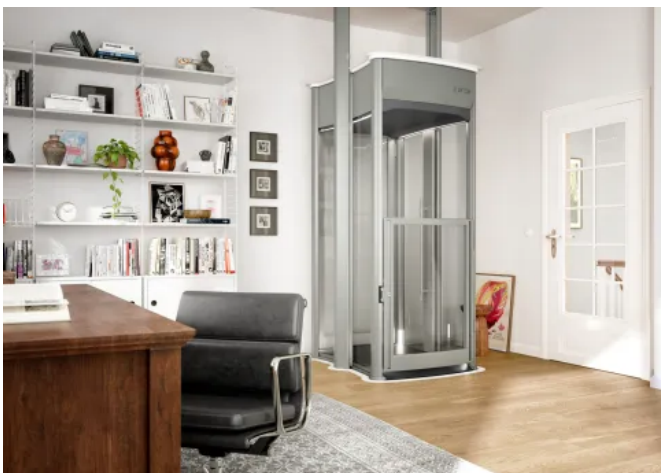
Homelift Lifton TRIO kann bis zu drei Personen oder eine Person mit Rollstuhl befördern.