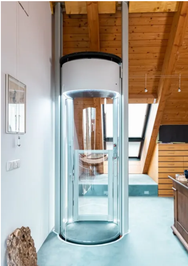
Homelift Lifton in Sonderform und -farbe