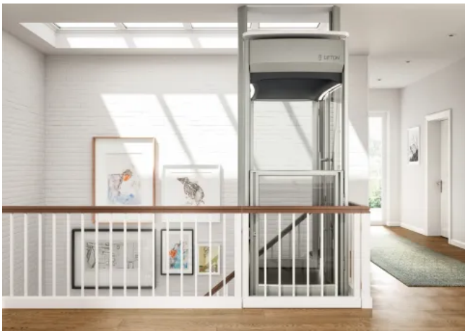
Homelift Lifton TRIO