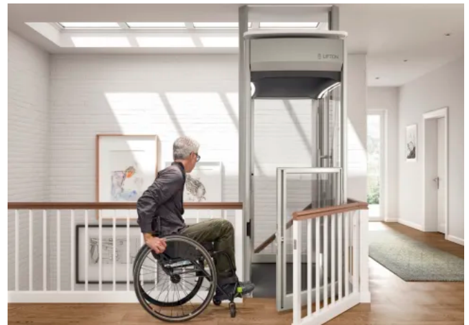
Homelift Lifton TRIO