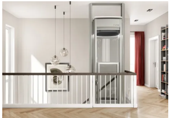
Homelift Lifton DUO