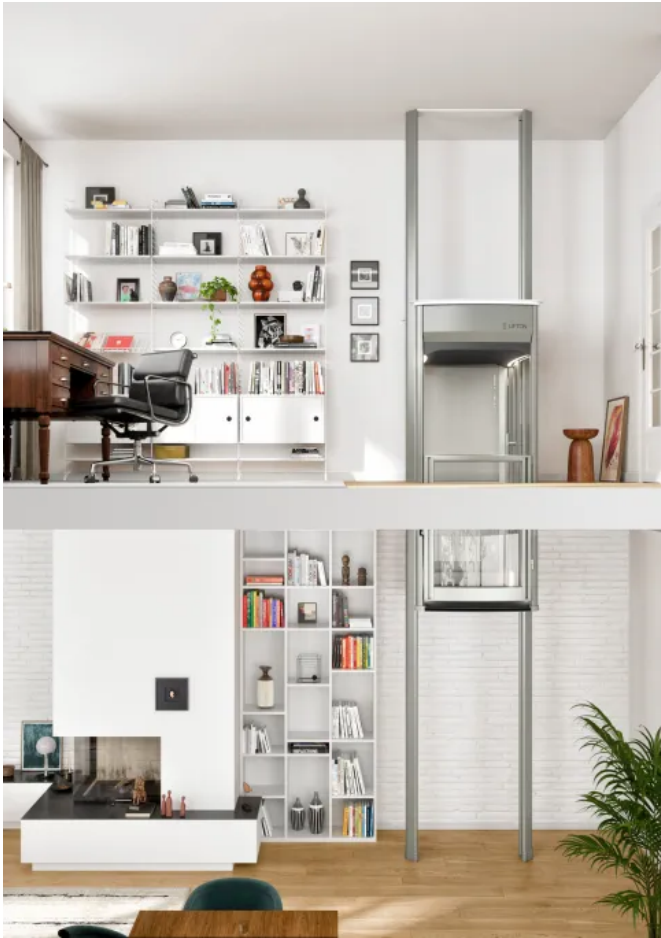
Lifton Homelifte bestehen aus einer Kabine und zwei Schienen, die frei im Raum platziert werden können.

Aus der Serie Lifton Privataufzüge von Liftstar