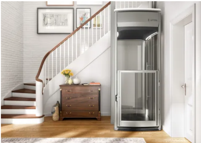
Homelift Lifton TRIO