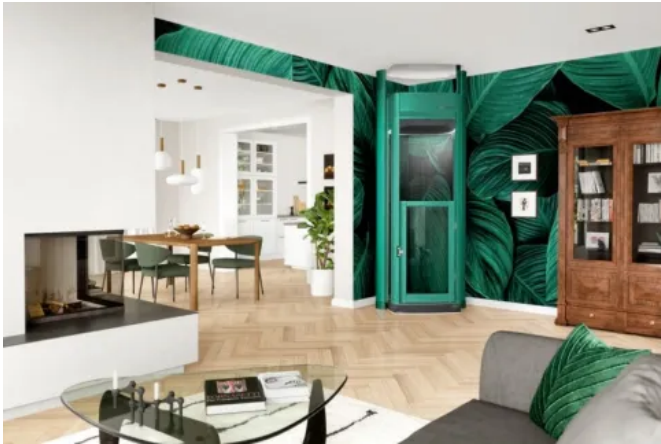
Homelift Lifton DUO, Oberfläche grün foliert

Aus der Serie Lifton Privataufzüge von Liftstar