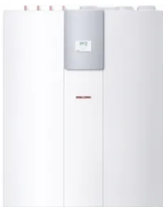
LWZ 5 S Plus

Kompaktgerät mit den Funktionen Lüften, Heizen, Warmwasserbereiten mit integrierte Kühlfunktion für Komfortgewinn in den Sommermonaten. Die LWZ 8 CS Premium lässt sich sowohl mit einer Solarthermie- als auch mit einer Photovoltaikanlage kombinieren.