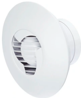
LA 70 VE-U