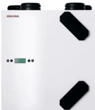
LWZ 70 E

Die wandhängende Geräte eignen sich für den Einsatz in Wohnungen, Einfamilienhäusern oder auch kleineren Gewerbeobjekten. Mit dem optimierten Wärmeübertrager des Lüftungsgeräts können bis zu 90% der Wärmeenergie aus der Abluft zurückgewonnen werden.