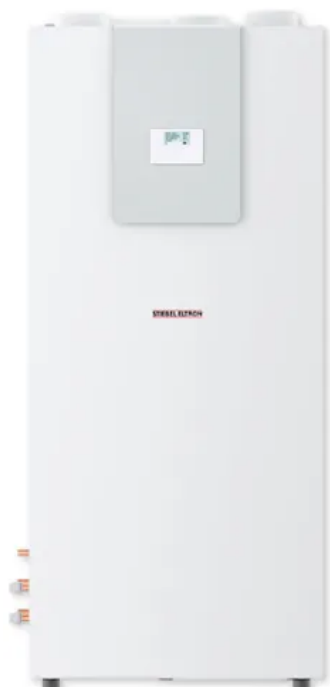
LWZ 8 S Trend

LWZ 5 S smart ist kompaktes Integral-System mit den Funktionen Warmwasserbereiten und Heizen für den Einsatz in neugebauten Einfamilienhäusern. .