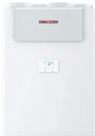
LWZ 180/280 / Enthalpie

Aus der Serie Lüftung von STIEBEL ELTRON