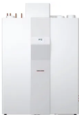
LWZ 604 air

Mit Lüften, Heizen und Warmwasserbereiten übernimmt die LWZ 5 S Plus alle entscheidenden Aufgaben in einem Einfamilienhaus. Bei der Lüftungsfunktion gewinnt das Modell bis zu 90 % der Wärme zurück, die sonst beim Lüften verloren gehen würde.