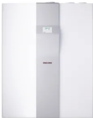
LWZ 8 CS Premium

Aus der Serie Lüftung von STIEBEL ELTRON