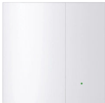
LA 60 (exemplarisch)

Die Geräte sind je nach gewählter Ausführung für Wand- und Deckeneinbau geeignet.