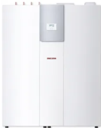
LWZ 5 S smart

Aus der Serie Lüftung von STIEBEL ELTRON