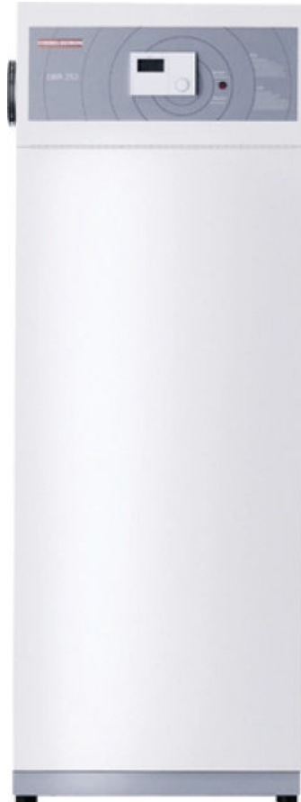
LWA 252 / SOL

Aus der Serie Lüftung von STIEBEL ELTRON