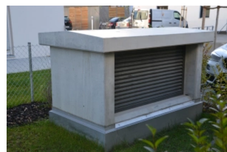
Lüftungsschacht als Betonfertigteile