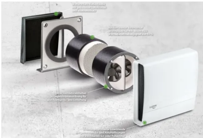
e 90 Zu- und Ablüfter mit Wärmerückgewinnung für Funktionsräume

Volumenstrom: 5 - 20 m 3 /h (WRG), 45 m 3 /h (Abluft)