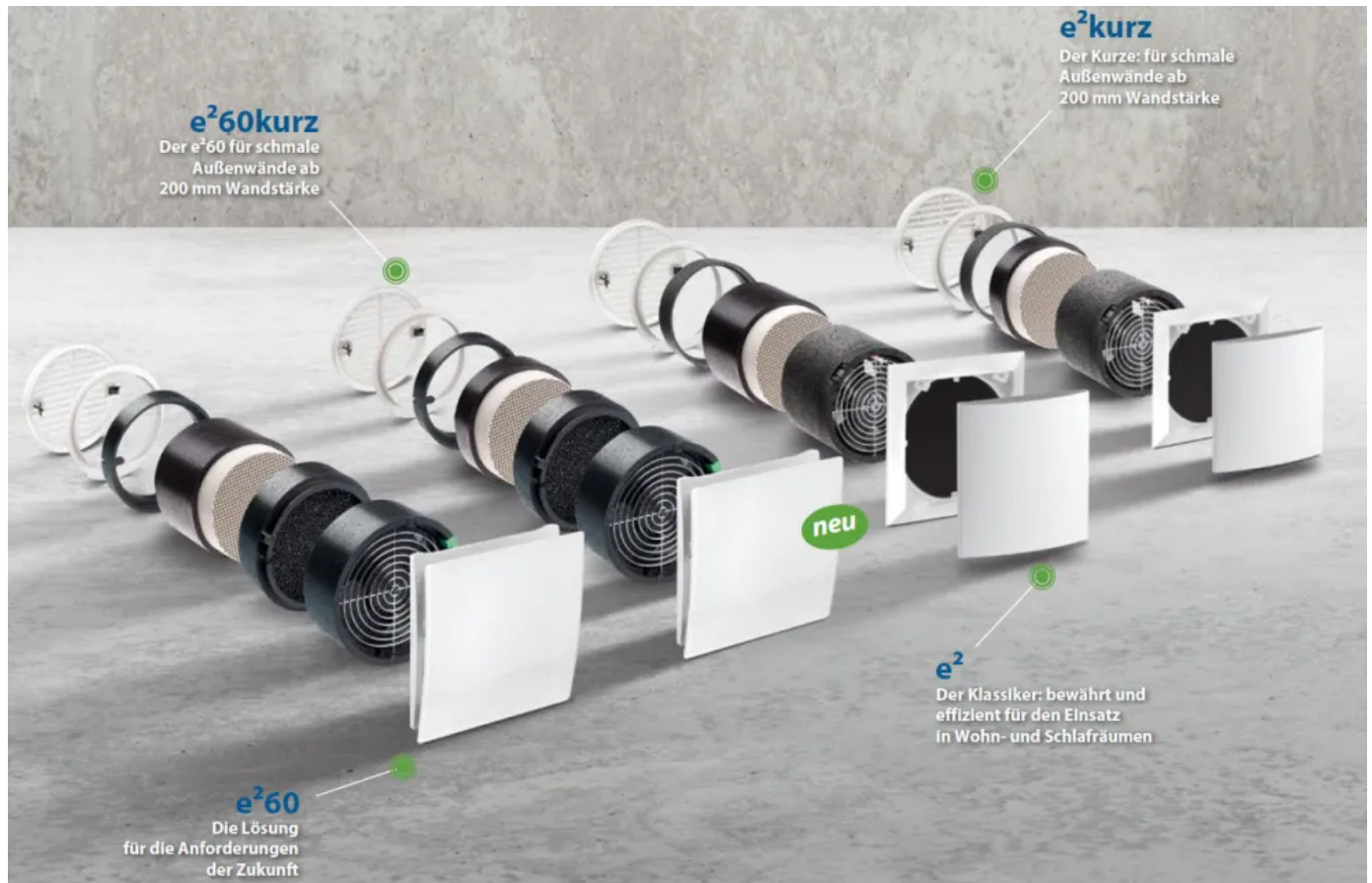
Lüfter der Serie e 2