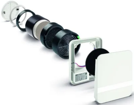
Lüfter der Serie e 2 mit Funkblende

Aus der Serie Lüftungssysteme für Wohngebäude von LUNOS Lüftungstechnik