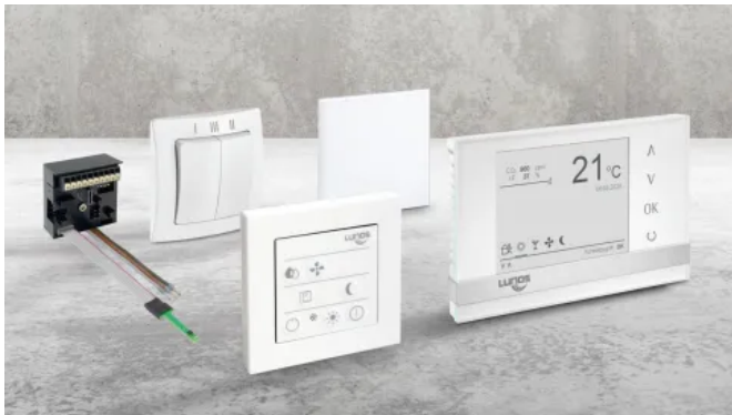
Steuerungen für Lunos Lüftungssysteme