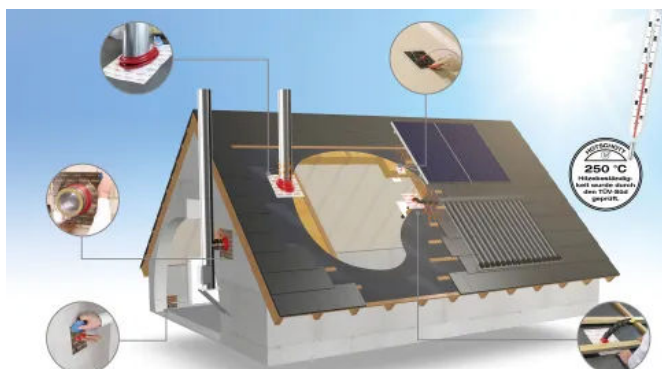
HOTSchott Manschetten verfügen über eine besonders hitzebeständige Tülle