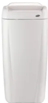
XIBU PAPERBOX Mülleimer / Papierbox - WHITE