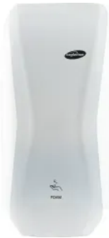
XIBU FOAM analog mechanischer Schaumseifenspender – WHITE