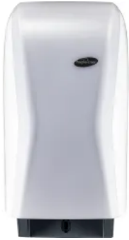
XIBU TISSUEPAPER analog Toilettenpapierspender - WHITE