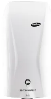
XIBU SEAT DISINFECT analog mechanischer Desinfektionsspender für die WC-Brille - WHITE