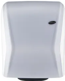
XIBU TOWEL analog mechanischer Papierhandtuchspender - WHITE