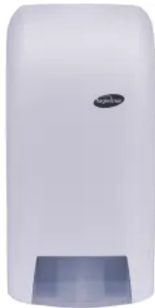
XIBU XL FLUID analog Industriespender - WHITE