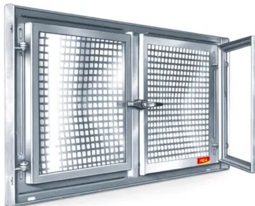
MEALIT zweiflügelig mit festem Mittelteil