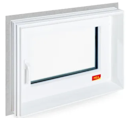
MEATHERMO AQUA PLUS

Die wasserdichten Zargenfenster MEATHERMO AQUA PLUS eignen sich für WU-Betonwände und sind besonders für den Einbau in Doppelwände geeignet. Der umlaufende Dichtflansch sorgt in beiden Fällen für eine lückenlose Betonanbindung und damit für Schutz vor eindringendem Wasser.