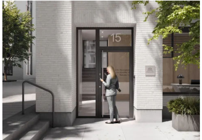
blueMotion+ von Winkhaus: Die vollmotorische Mehrfachverriegelung für exklusive Eingangstüren.

Das integrierte Bluetooth-/WLAN-Modul ermöglicht auch hier die Steuerung über die doorControl App, während zusätzliche Features wie die Tag/Nacht-Funktion oder Holiday-Lockout-Funktion maximale Sicherheit und Flexibilität bieten.