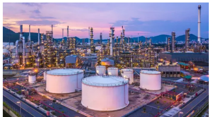
IEEx / ATEX