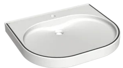
Prämiertes Design: VARIUScare mit Farbstreifen im Waschtischrand

Der VARIUScare Waschtisch ist Gewinner des ZVSHK-Awards 'Badkomfort für Generationen' , der auf der ISH im März 2019 vom Zentralverband Sanitär Heizung Klima (ZVSHK) verliehen wurde. Der Preis zeichnet Produkte rund um das Bad aus, die Ästhetik mit barrierefreier Funktionalität verbinden. VARIUScare zählt auch zu den Preisträgern des German Design Award 2020 in der Kategorie 'Medical, Rehabilitation and Health Care' . Der Rat für Formgebung - das deutsche Kompetenzzentrum für Design, Marke und Innovation - zeichnete die barrierefreie Waschtisch-Linie unter dem Gesichtspunkt 'Excellent Product Design' in dieser Kategorie aus.