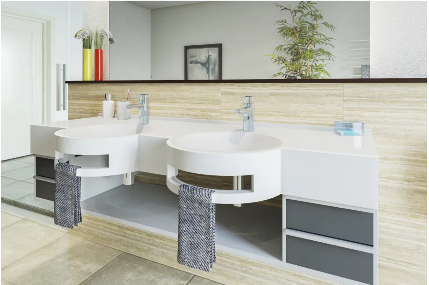
VARIUS D-Form mit vorstehender R-Mulde

Aus der Serie Sanitärraumausstattungen aus MIRANIT von KWC Aquarotter