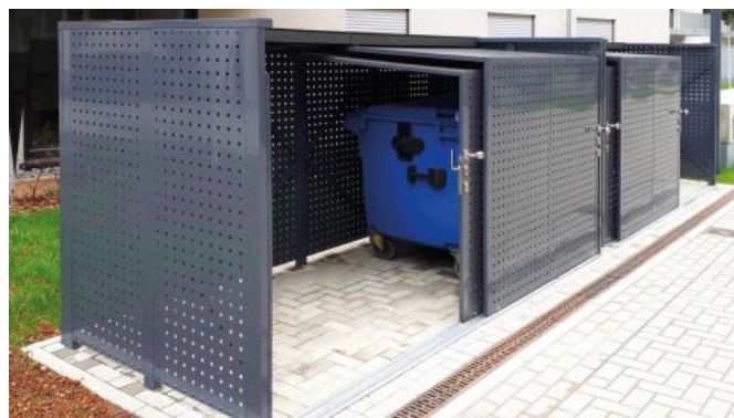
Mülltonnen-Boxen XL, Quadratlochblech