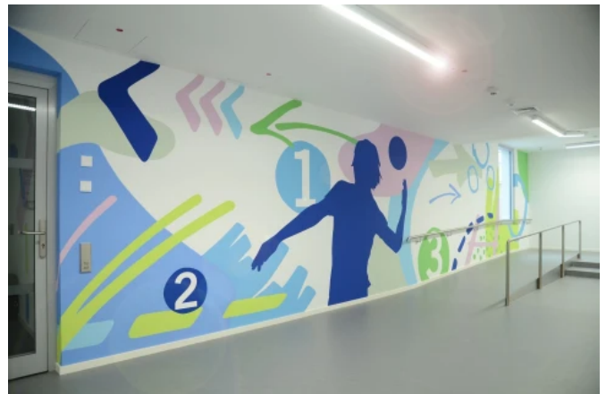
Sporthalle am Böllenfalltor, Darmstadt - Planung: Jörn Heilmann