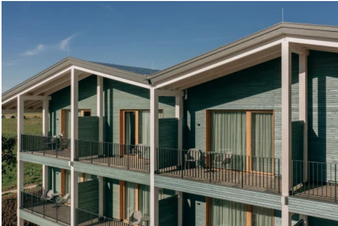
Landhotel Bohrerhof, Hartheim am Rhein - Planung: Rudolf Johannes Lais, Lais Architekten

Aus der Serie Nachhaltige Beschichtungen von CAPAROL Farben Lacke Bautenschutz