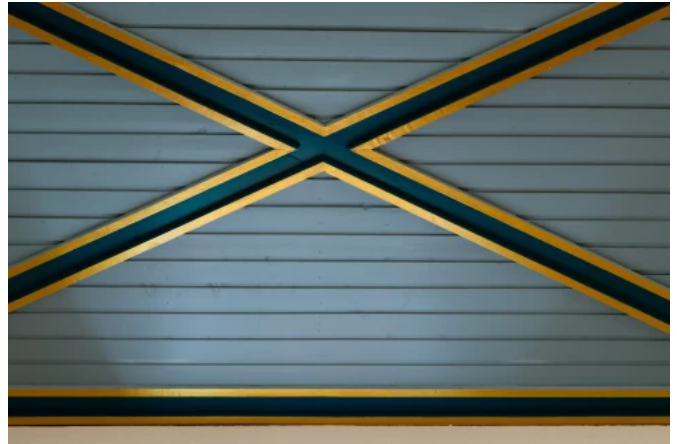
Katholische Kirche St. Walburga, Groß Gera - Planung: Dipl.-Ing. Heinz Raab Ingenieurbüro für Planung und Bauwesen