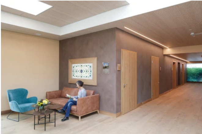
Landhotel Bohrerhof, Hartheim am Rhein - Planung: Rudolf Johannes Lais, Lais Architekten

Aus der Serie Nachhaltige Beschichtungen von CAPAROL Farben Lacke Bautenschutz