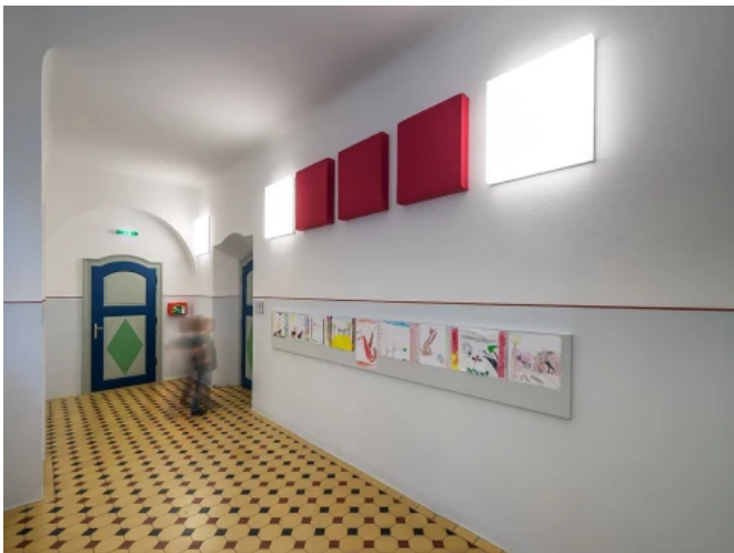
Volkschule Marbach - Planung: Bauer-Brandhofer Architekten