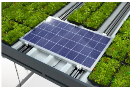
GreenPlus kombiniert mit Beleuchtungssystem InLight+ mit VersoVolt 115 Photovoltaiksystem