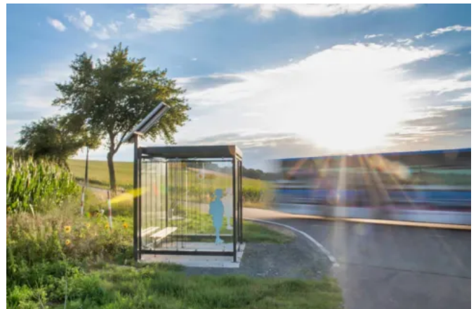
WSM Haltestellenüberdachungen bieten Komfort und Sicherheit.