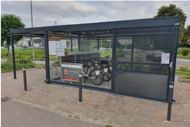
Die überdachte Abstellfläche sorgt für einen geschützten und sicheren Standort für Fahrradparker und E-Bike Leih- und Ladestation.

Aus der Serie Stadtmobiliar von WSM - Walter Solbach Metallbau