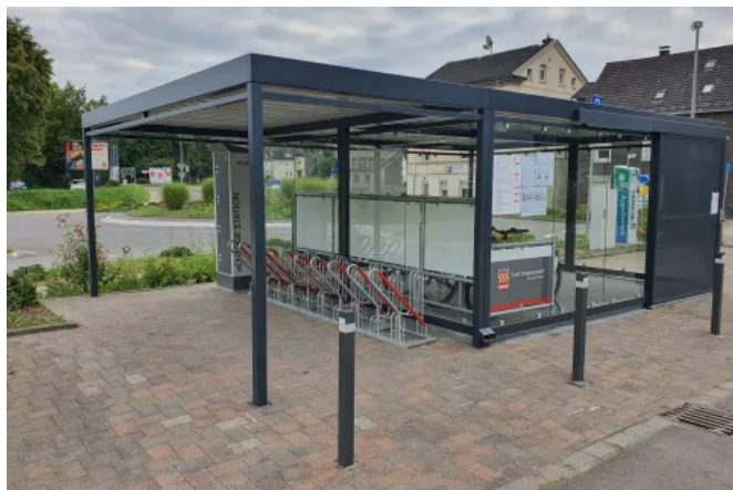
Die Mobilitätsstation Bergneustadt kombiniert Fahrradparken, eBike-Sharing und Ladestationen unter einem Dach.

Die überdachte Abstellfläche für einen geschützten und sicheren Standort für das eBike-Sharing-System. Sowohl Pendler als auch Freizeitnutzer können vor Ort bequem Elektrofahrräder ausleihen und laden.