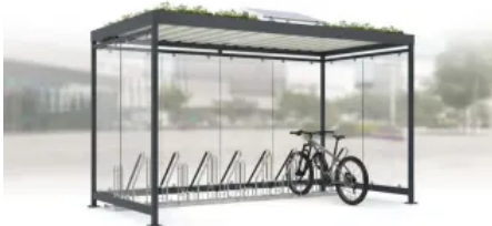
Fahrradüberdachung Köln Dachbegrünung und Solarmodul

Aus der Serie Stadtmobiliar von WSM - Walter Solbach Metallbau