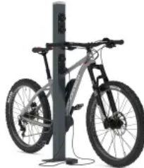
E-Bike Ladesäule mit integrierter 230V-Schutzkontakt-Steckdose (IP54)