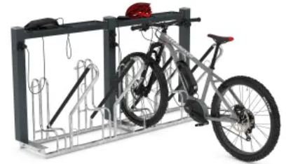
Ladestation für die Anlehnarker Modelle 4500 XBF, 4700 XBF und 2500 XBF