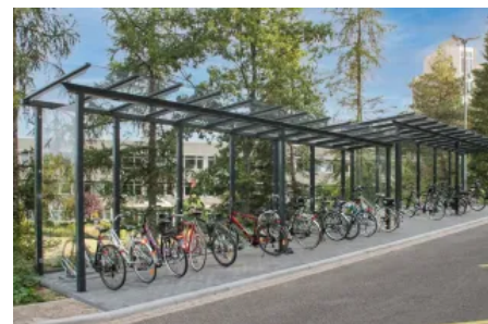
Überdachungssysteme – optional fertig montiert