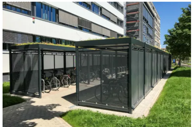
Fahrradüberdachung Köln mit Dachbegrünung und Anlehnbügel