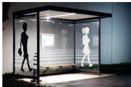
InLight – passendes Lichtsystem für Überdachungen

Mit langjähriger Erfahrung bietet Überdachungs- und Fahrradparksysteme für Städte, Unternehmen und öffentliche Einrichtungen an, die sich mit Zubehör- und Ausstattungsoptionen den individuellen Anforderungen anpassen.