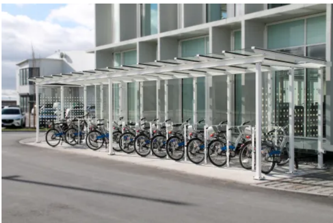
Überdachungssystem Passau mit Fahrrad-Anlehnbügel

Vervollständigt wird die Mobilitätsinfrastruktur durch Fahrradparksysteme, mit denen Fahrräder und E-Bikes nicht nur sicher abgestellt, sondern gleichzeitig aufgeladen werden können.