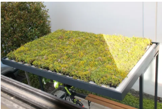
Die Dachbegrünung GreenPlus filtert Feinstaubfilterung und speichert Regenwasser.

GreenPlus Economy ist eine kostengünstige, pflegeleichte Begrünungslösung mit robustem Sedumpflanzen-Mix, die für Feinstaubfilterung, Regenwasserspeicherung und Lärminderung sorgt.