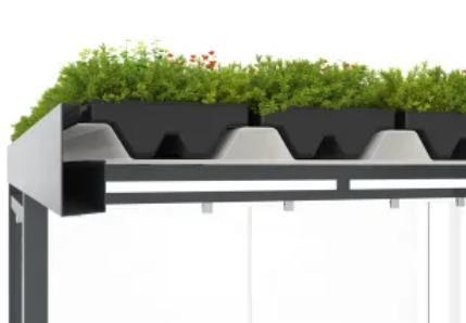
GreenPlus Dachbegrünung für Überdachungssysteme mit Trapezblechprofil-Dacheindeckung

Aus der Serie Stadtmobiliar von WSM - Walter Solbach Metallbau