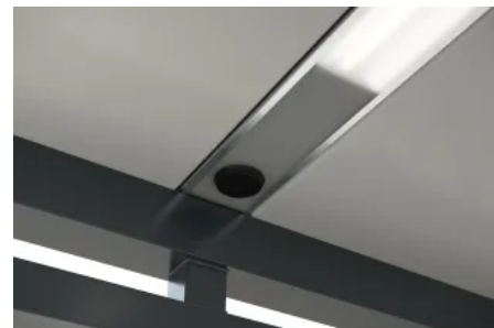
Mit energiesparenden LEDs und leuchtet InLight die gesamte Fläche unter der Überdachung aus.