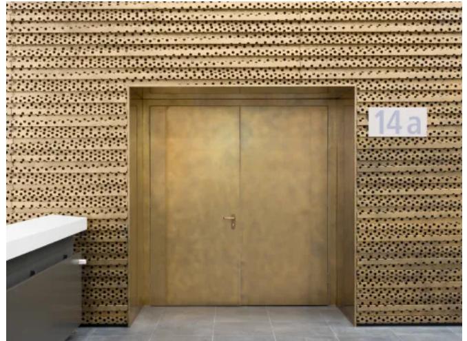
Nordic Brass Weathered