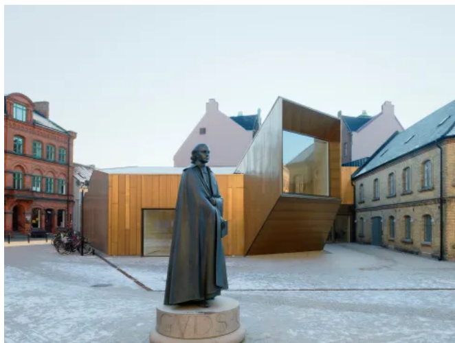
Nordic Brass - Domkyrkoforum Lund Schweden

Beim Projekt Domkyrkoforum in Lund – Schweden hat die Designerin Carmen Izquierdo genau auf diesen natürlichen Bewitterungseffekt gesetzt. Mit der Zeit passt sich die Fassade der Messing Statur im Vordergrund an und bildet somit ein harmonisches Ensemble.