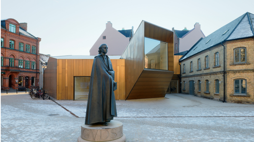
© Fotograf Åke E:son Lindman AB. Maria Bangata 4A.118 63 STOCKHOLM

VM Building Solutions Deutschland GmbH Ruhrallee 175 45136 Essen Deutschland