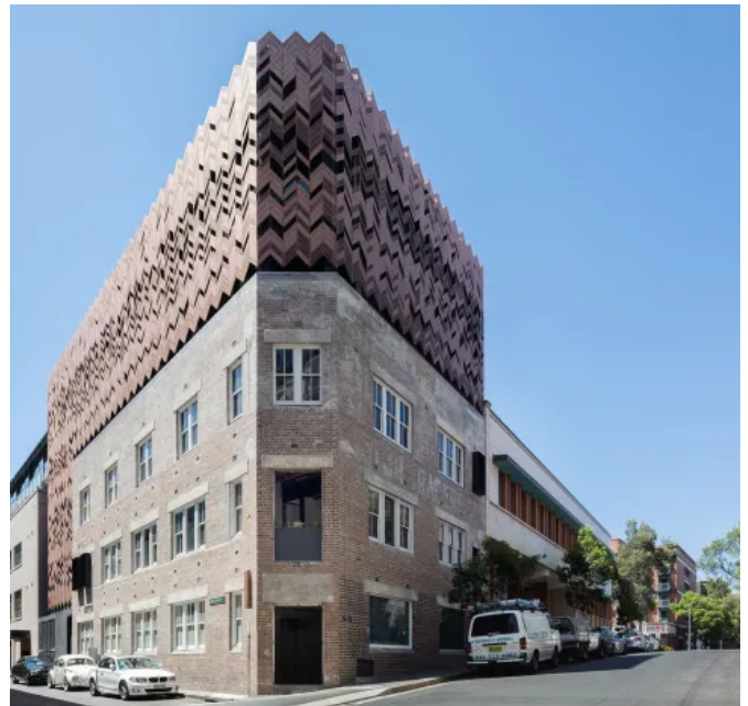
Paramount-Hotel - Nordic Standard - Sydney Australien - Breath Architecture