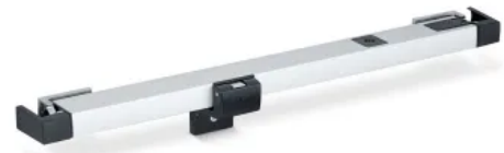
Slimchain 230 V – Kettenantrieb