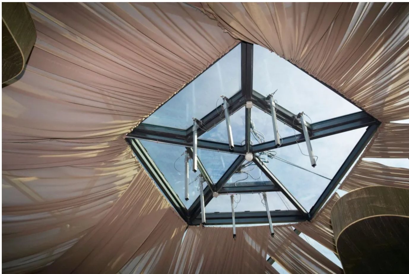
E350 N – Spindelantrieb in 230 V-Ausführung mit umfangreichem Konsolenprogramm