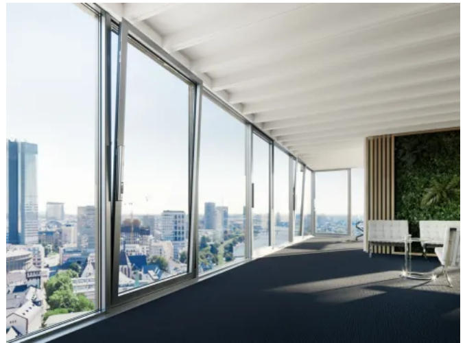
Das F 1200+ System für Fassade mit großen Fensterelementen