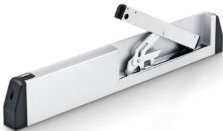
E 170 – Scherenantrieb