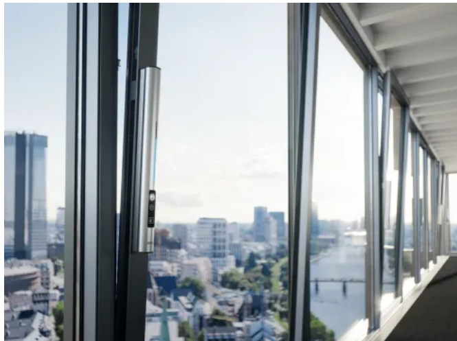
Das F 1200+ System für große und schwere Fensterelemente

Das F 1200+ System ist ein leistungsstarkes Drehkippschlagssystem zur täglichen Lüftung für gängige bis sehr große Fensterelemente.