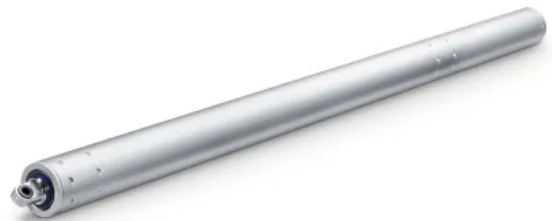
E 3000 – Spindeltrieb