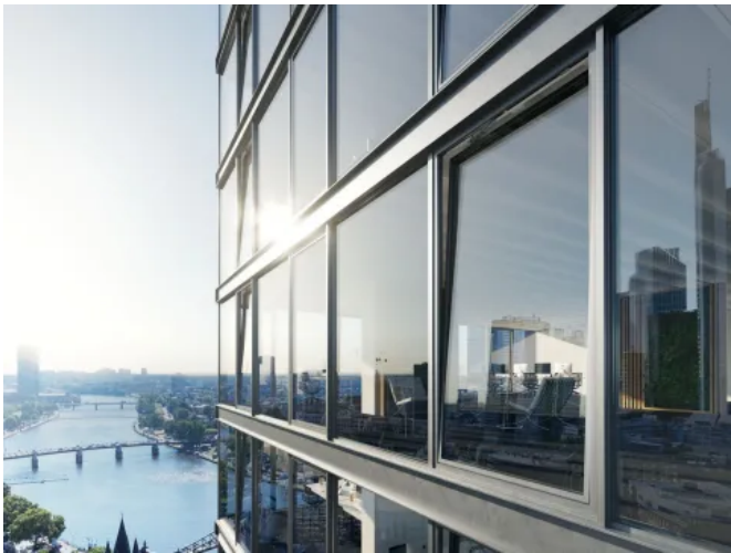
Das F 1200+ System für Fassade mit großen Fensterelementen