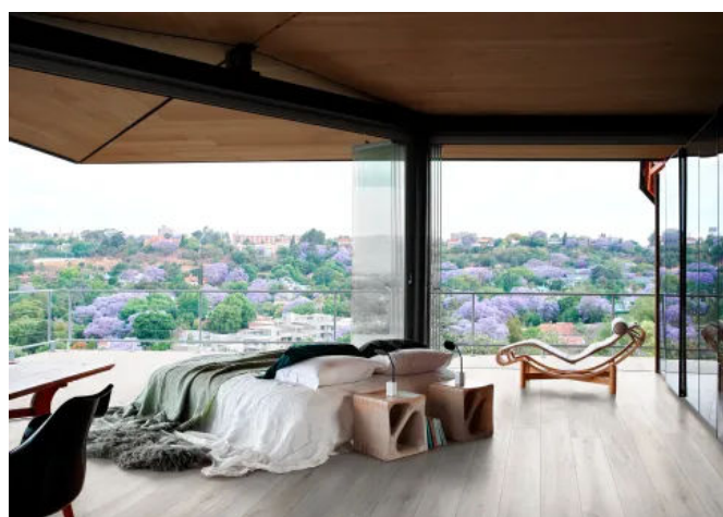
Oltre White Rett. 22,5x180 und White Grip Rett. 20x120

Die Fliesen der Reihe Oltre gibt es in vier Farben in warmen und natürlichen Tönen: