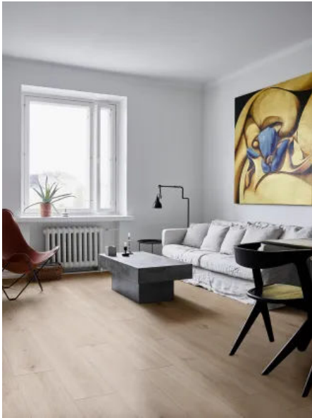
Oltre Natural Grip Rett. 30x120

Aus der Serie Keramikfliesen für Wand und Boden von MARAZZI