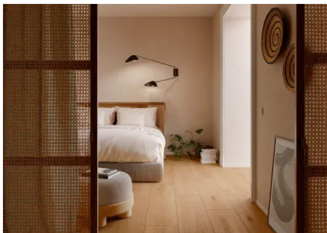
Oltre Caramel Rett. 30x120