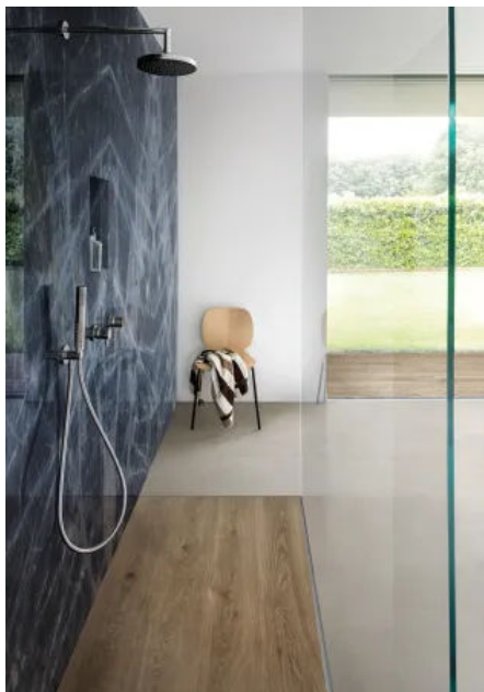
Oltre mit Grande Marble