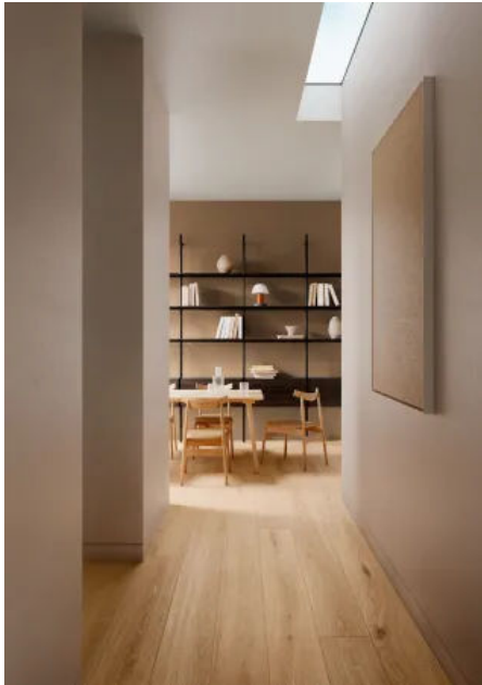
Oltre Sand Rett. 22,5x180

Aus der Serie Keramikfliesen für Wand und Boden von MARAZZI