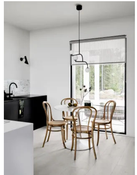
Oltre White Rett. 30x120