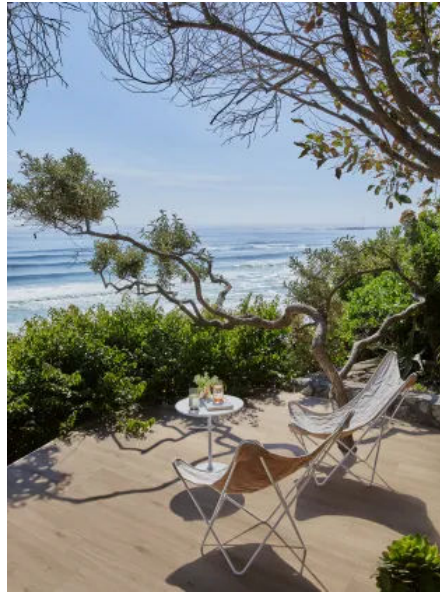
Oltre Natural Grip Rett. 30x120 und Natural Grip Rett. 20x120