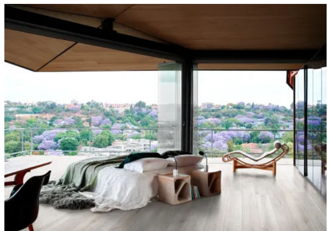
Oltre White Rett. 22,5x180 und White Grip Rett. 20x120

Die Fliesen der Reihe Oltre gibt es in vier Farben in warmen und natürlichen Tönen: