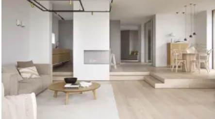
Prestige (14 mm)

Aus der Serie Parkett von Tarkett Holding