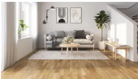
Pure Holzboden Kollektion (13 & 14 mm)

Die Pure Holzboden Kollektion (13 & 14 mm), ist in Qualität, Tradition und Beständigkeit verwurzelt. Die naturbelassenen Holzarten Esche, Birke, Buche und Eiche sorgen für ein natürliches Ambiente. Jede einzelne Diele besitzt ihren ganz eigenen und von Mutter Natur gegebenen Charm und Charakter.