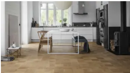
Noble (16 mm)

Traditionelle Flechte erfährt mit Noble (16 mm) eine zeitgemäße Renaissance, denn Tarkett lässt aus diesem klassischen Verlegemuster etwas völlig Neues entstehen. Die mit Hartwachs-Öl veredelten Oberflächen weisen eine besondere Bürstung auf, die analog zur Maserung aufgebracht werden. Auf diese Weise entsteht ein verblüffender 3D-Effekt mit raffiniertem Lichtspiel, über die gesamte Raumfläche hinweg.