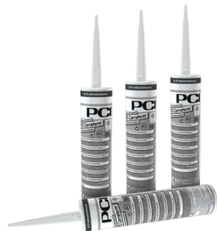
PCI Carraferm® Silikon-Dichtstoff für Naturwerksteine