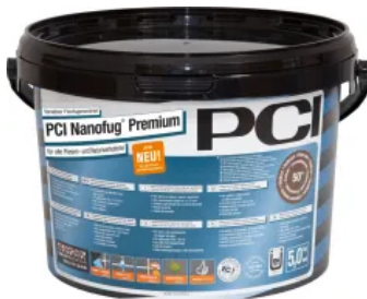
PCI Nanofug® Premium