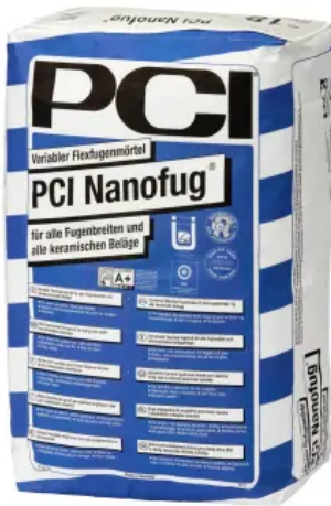
PCI Nanofug® – insbesondere für Steingut- und Steinzeugbeläge

Aus der Serie PCI-Fliesenkleber und -Fugenmörtel für alle Keramik- und Naturwerksteinbeläge von PCI Augsburg